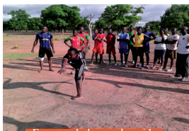
Epreuve du lancer de poids

Sud-ouest: Epreuves sportives du baccalauréat session 2016 dans le IOBA