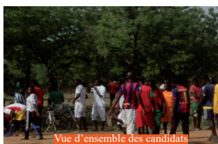
Vue d'ensemble des candidats