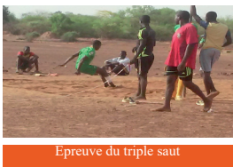
Epreuve du triple saut