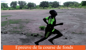
Epreuve de la course de fonds