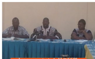
Les représentants de l'UNEEPL