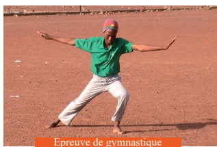
Epreuve de gymnastique