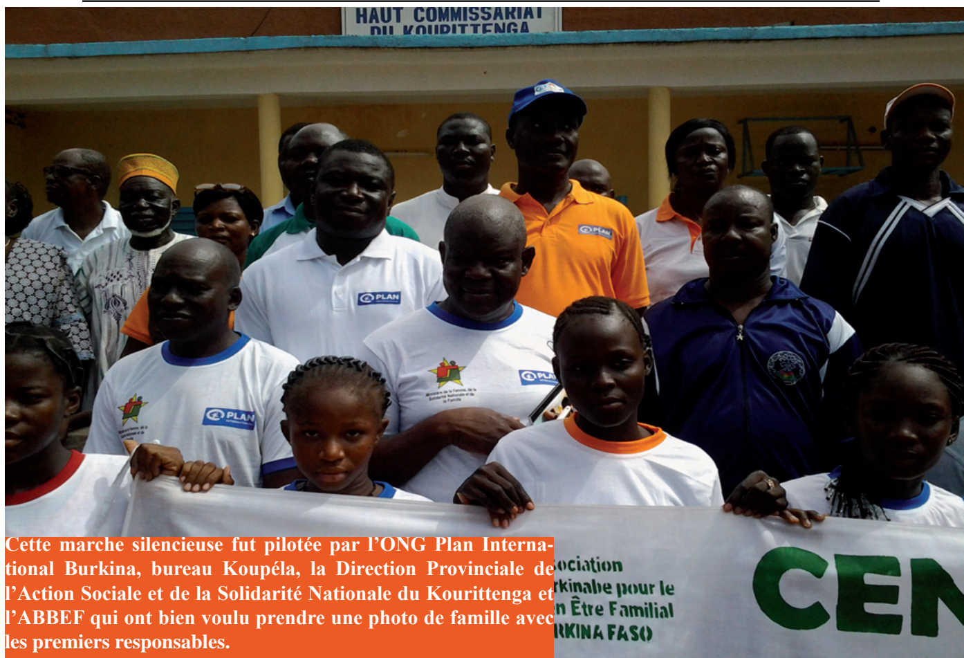
Cette marche silencieuse fut pilotée par l'ONG Plan International Burkina, bureau Koupéla, la Direction Provinciale de l'Action Sociale et de la Solidarité Nationale du Kourittenga et l'ABBEF qui ont bien voulu prendre une photo de famille avec les premiers responsables.

qui révèle cent vingt-neuf (129) cas de grossesses enregistrés pour cette année scolaire 2015-2016 dans les établissements secondaires de la commune urbaine de Koupéla contre quatre-vingt-deux (82) en 2014-2015.