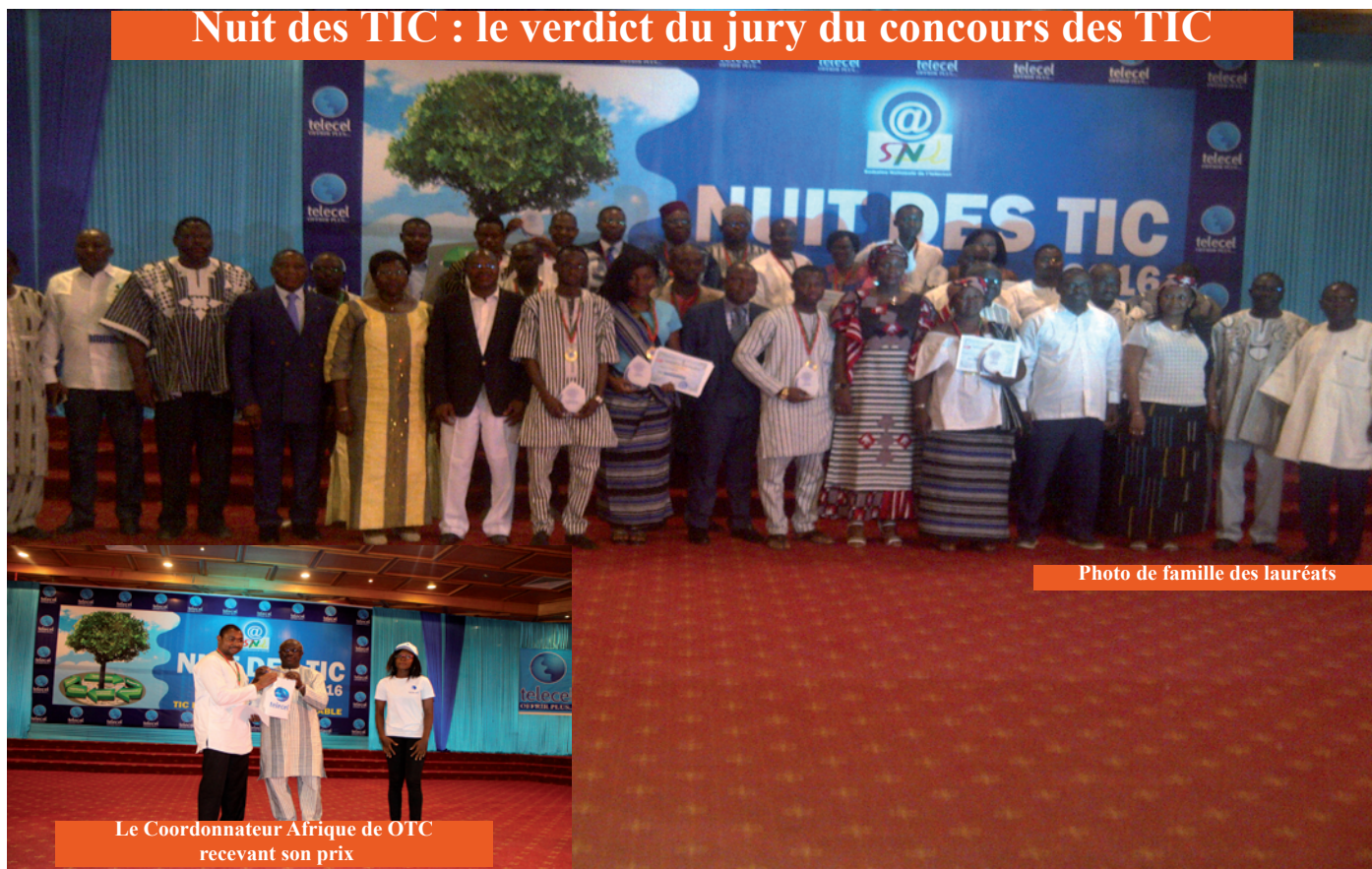
Photo de famille des lauréats