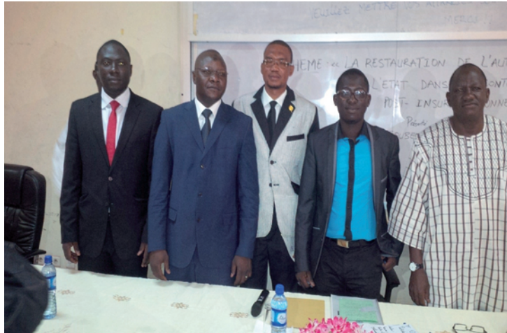
Les membres du Jury avec l'impétrant au milieu

tionnel que le Burkina connaît. Pionnier de cette session inaugurale des soutenances, l'impétrant a obtenu la note de 15/20. Et il se réjouit non