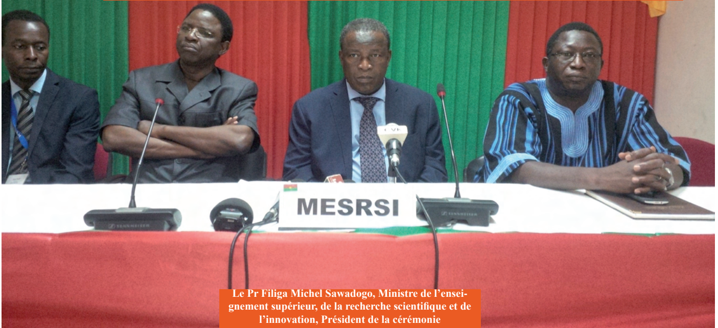
Le Pr Filiga Michel Sawadogo, Ministre de l'enseignement supérieur, de la recherche scientifique et de l'innovation, Président de la cérémonie

L'Université Ouaga 1 Pr Joseph Ki-ZERBO abrite du 07 au 09 juin 2016 un colloque international sur les passages en Afrique. C'est un colloque initié par plusieurs universités et instituts d'Afrique et du Canada qui réunit plusieurs professeurs. Son objectif, c'est de penser sur la contribution des lettres aux changements pacifiques de régime en Afrique.