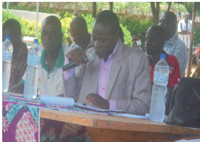
Le PDS faisant le bilan du mandat de la délégation spéciale

De l'administration communale, la situation des actes civil de 2015 est de