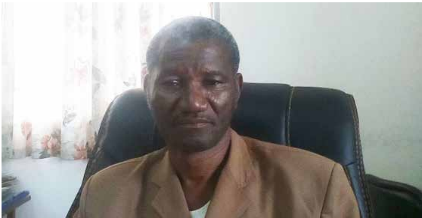
Monsieur le Directeur de l'Ecole Normale Supérieure de Koudougou.

A près trois mois de formation les nouveaux professeurs du programme emploi-jeune pour l'éducation nationale (PEJEN) sont prêts pour servir sur le terrain. Débutée le 04 juillet dernier, la formation théorique des professeurs au compte du ministère de l'éducation nationale a pris fin le 08 octobre. Selon le Directeur de l'Ecole Normale supérieure de Koudougou, ces nouveaux professeurs du PEJEN se sentiront à l'aise pour enseigner au regard de la qualité de la formation qu'ils ont reçue. Mais l'arbre ne doit pas cacher la forêt. Cette formation théorique à l'école ne s'est pas déroulée sans difficultés.