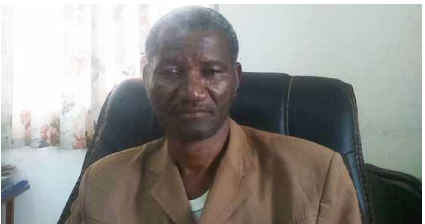
Monsieur le Directeur de l'Ecole Normale Supérieure de Koudougou.