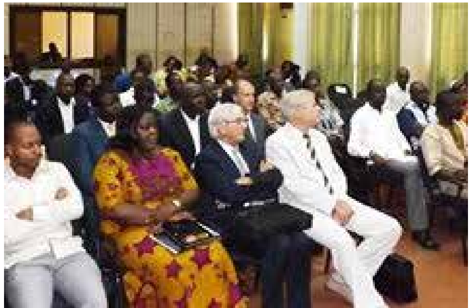
Les participants à la formation.

Au-delà des concepts théoriques qui seront dispensés, a indiqué le Garde des Sceaux, cette formation se veut un espace d'échanges sur les méthodes et pratiques de gestion de vos juridictions afin d'harmoniser les vues, les méthodes et de retenir les règles et bonnes pratiques managériales.