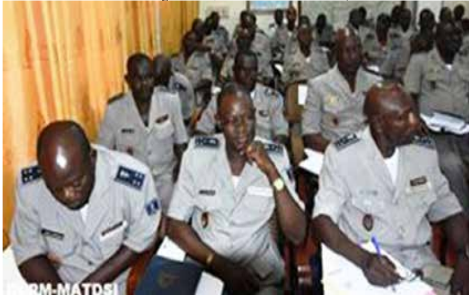
Les responsables de la police nationale, écoutant avec attention le ministre.

dans des contextes un peu difficile. Nous ne devons pas tenir des propos qui sapent leur moral. C'est en rang serré que nous pourrons bouter le terrorisme hors de nos pays», a ajouté le ministre.