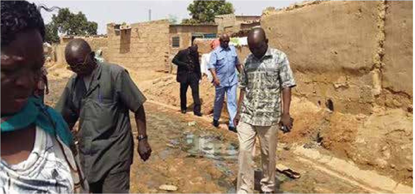
Le maire de la ville de Ouagadougou, en pleine visite avec son équipe.

L e Maire de la commune de Ouagadougou, M. Armand BEOUNDE prendra part à la troisième conférence des Nations Unies consacrée aux établissements humains. C'est Quito, la capitale de l'Equateur qui abritera cette conférence habitat III. En prélude à cette importante rencontre, l'édile de la capitale était à Bissighin dans la banlieue Nord- Est de la ville.