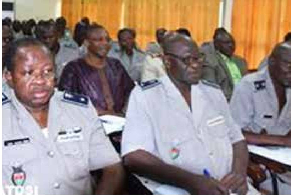
Les responsables de la police nationale, écoutant avec attention le ministre.

Cette rencontre a été une occasion pour le ministre en charge de la sécurité intérieure, de faire le point de la situation sécuritaire à ses hommes et de remonter leur moral. « Il s'est agi pour nous de leur apporter tous nos encouragements afin qu'ils puissent répercuter ce message à leur base. Nous leur avons demandé aussi d'être vigilent et de prendre des précautions pour que rien ne se passe à leur insu. Ils doivent être sur leurs gardes », a