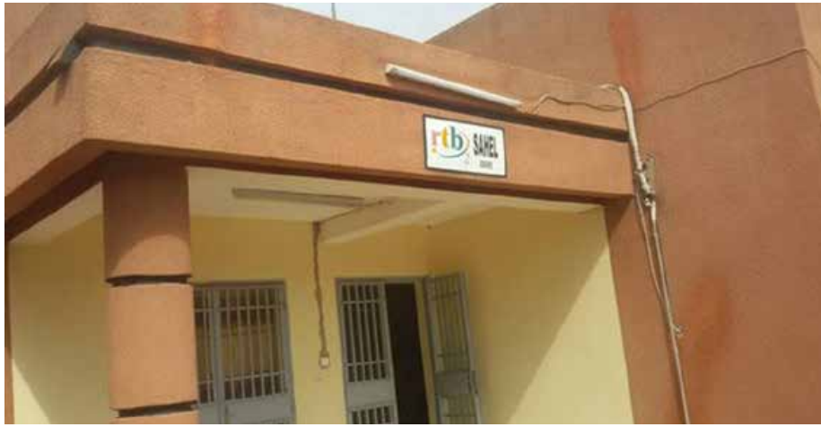
Siège de la radio télévision du Burkina au sahel.

Concernant les revendications dans l'hôtel administration de la des travailleurs de l'information, région, les difficultés sont les mêmes: