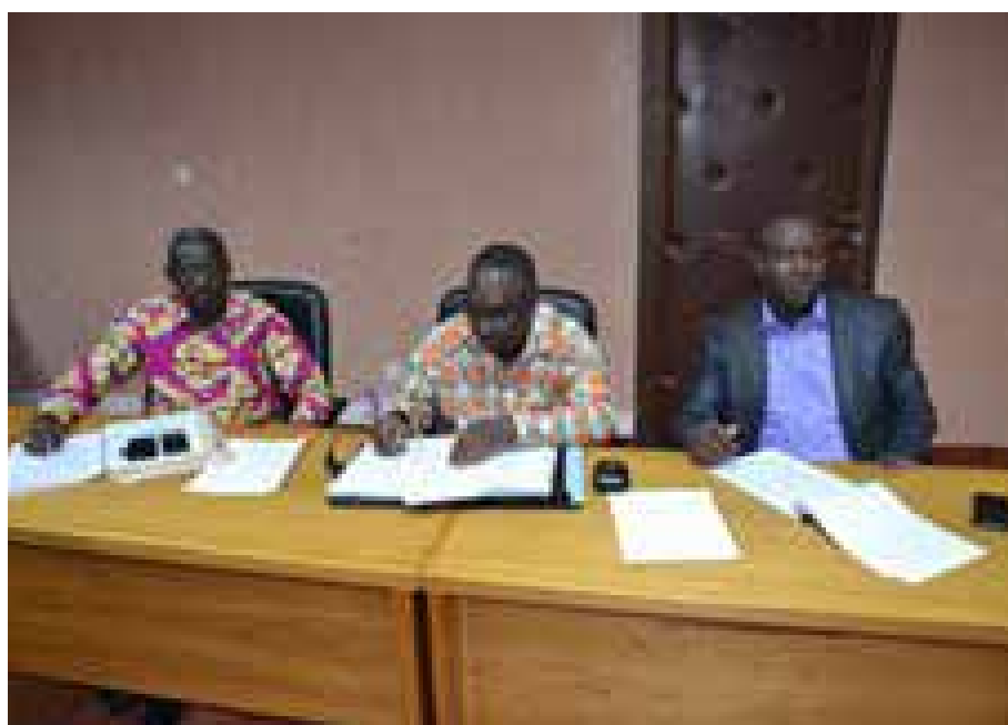
Les participants à la rencontre.

Afin de trouver des solutions à la crise, le ministre de l'Urbanisme et de l'Habitat Dieudonné Maurice Bonanet a convoqué tous les promoteurs Immobiliers intervenant à Saaba.