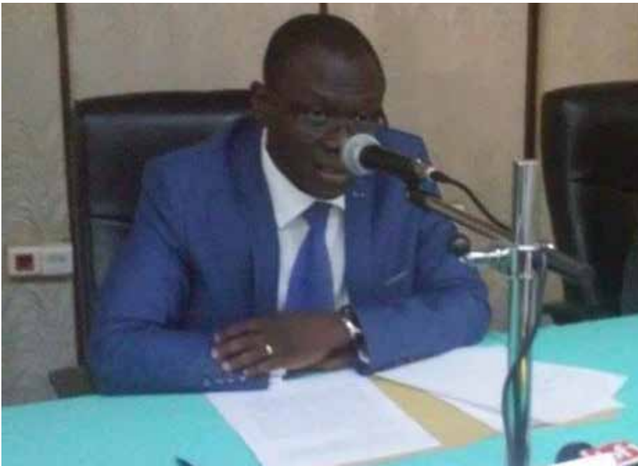
Le ministre de la justice, échangeant avec les participants à la formation.

leurs capacités en management des juridictions afin d'accroître les performances des juridictions. De façon spécifique, il s'agit de :