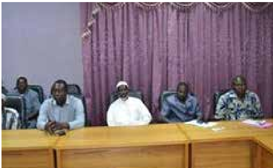
Les participants à la rencontre.