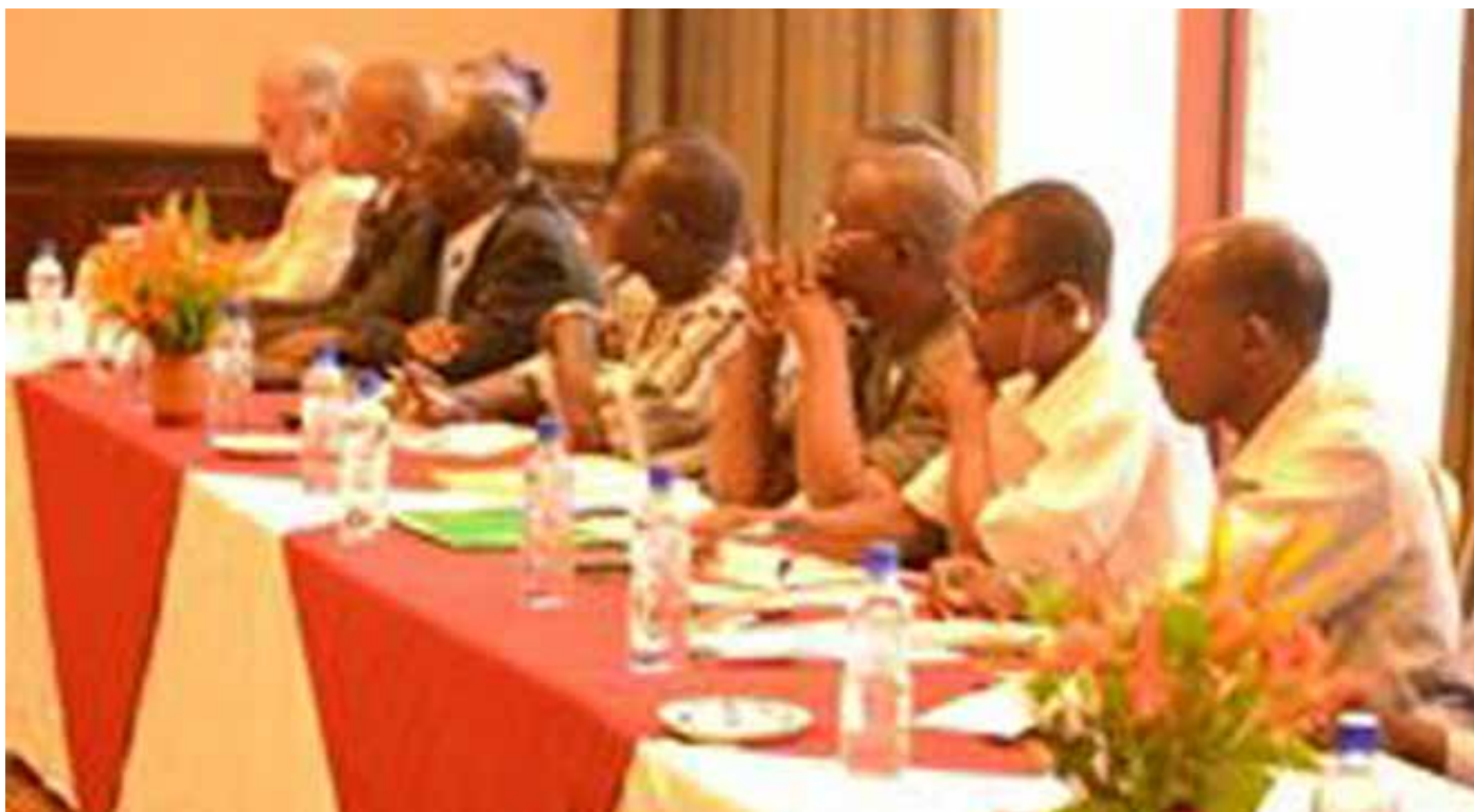
Les participants à l'atelier.

D ans le cadre du Lancement du Projet GOUVERNANCE , dénommé : « Améliorer la gouvernance du travail dans les TME/PME et aider à la sortie de l'économie informelle en Afrique », le Ministère de la Fonction Publique, du Travail et de la Protection Sociale a organisé un atelier national tripartite à Ouagadougou le lundi 17 octobre 2016 .