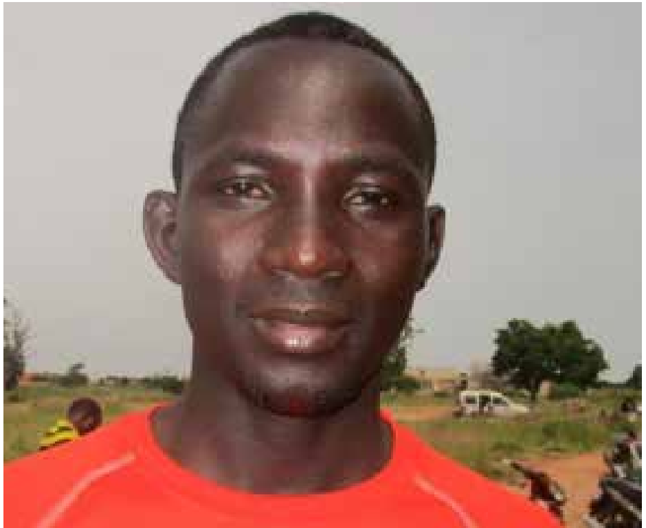
Zongo Tanga: option français histoire géographie.

«La formation a été de niveau, cela va nous permettre de relever un temps soit peu notre niveau et aussi cela va nous permettre d'être efficace sur le terrain vu que les professeurs se sont donnés pour nous livrer le savoir. Avec les attestations on est motivé, encouragé d'aller sur le terrain et de faire notre mieux pour transmettre le savoir dans