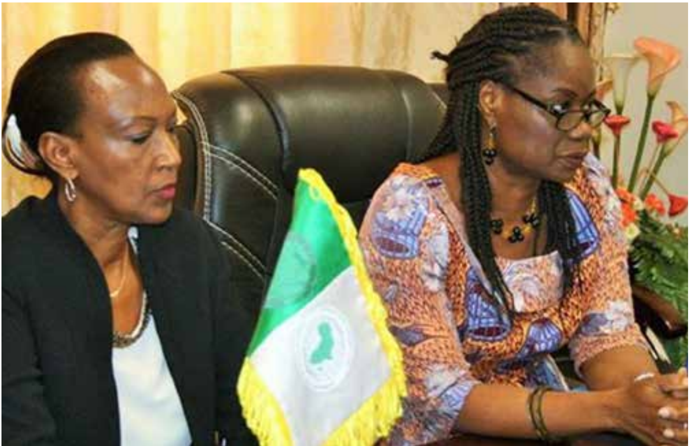
La Représentante Résidente de la Banque Africaine de Développement (gauche) et la ministre de l'économie et des finances du Burkina.