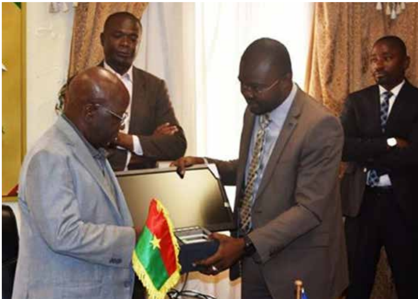
Le ministre de la sécurité intérieure, réceptionnant le matériel.

L e bureau pays de l'Organisation internationale pour les migrations (OIM) au Burkina Faso, a remis le mardi 18 octobre 2016, un lot de matériel pour l'équipement en système d'analyse des données et des informations migratoires (MIDAS) des postes frontaliers de Dakola, Madouba et Yendéré. C'est le ministre d'Etat en charge de la sécurité intérieure, Simon Compaoré, qui a réceptionné ledit matériel, en présence de l'Ambassadeur du