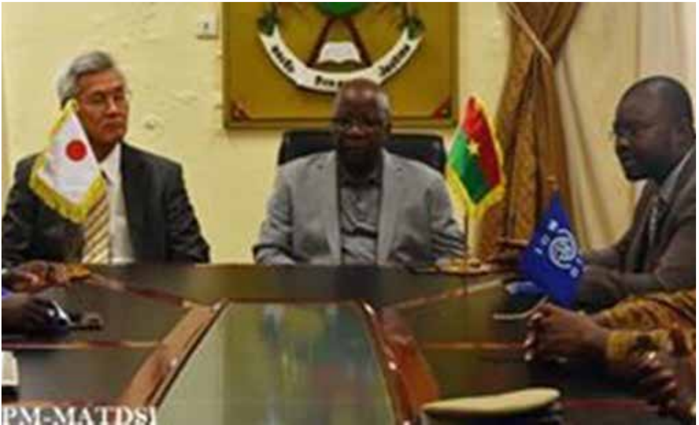
Le ministre de la sécurité avec à ses côtés, l'Ambassadeur du Japon au Burkina.