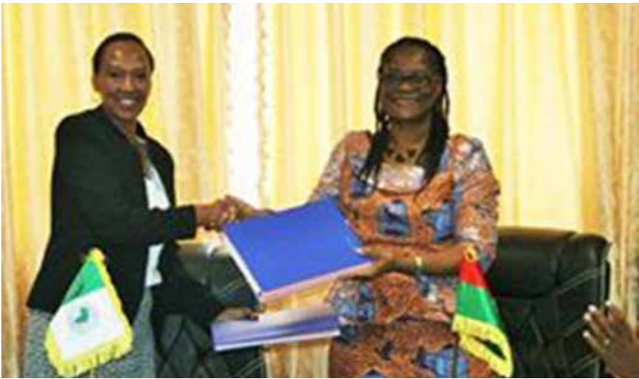
Signature de convention entre la Banque africaine de développement et l'Etat burkinabè.

Elle a par ailleurs salué le leadership et l'engagement de la représentante résidente de la BAD, dans le renforcement des relations entre son institution et le Burkina Faso.