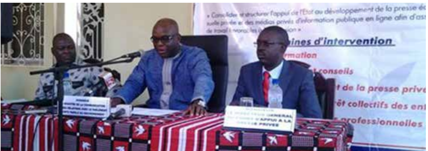
Le ministre de la communication a lancé le fonds d'appui à la presse privée.