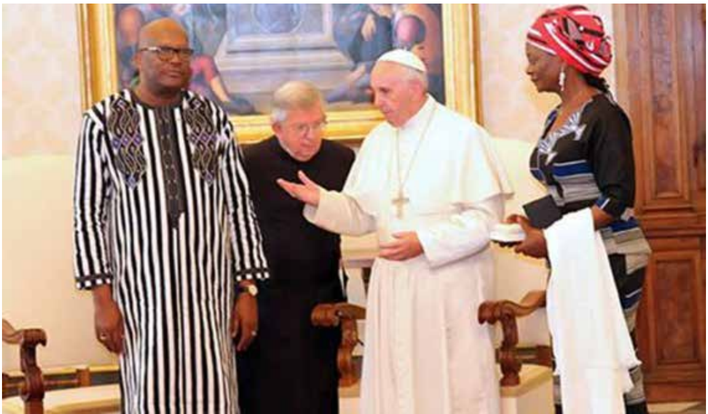
Le président du Faso, reçu par le Pape.

L e Souverain pontife, le Pape François a reçu en audience le Président du Faso, S.E.M. Roch Marc Christian KABORE le jeudi 20 octobre 2016 au Vatican. C'est à 10 heures précises (8 heures T.U.), que les Gentils hommes du