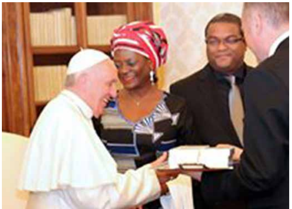
La première dame du Faso, en compagnie du Pape.

Roch Marc Christian KABORE a aussi exprimé au Souverain pontife, la gratitude du Burkina Faso pour l'ensemble des actions de l'Eglise, mais aussi et surtout pour les pensées pieuses et les prières dites à l'endroit de notre pays durant les moments de crises. Le Pape François a salué le dialogue inter-religieux qui aujourd'hui fait la fierté du Burkina Faso. La présence des différentes communautés au Vatican se justifie par l'harmonie qui règne entre elles et permet de montrer au Souverain pontife comment ces communautés vivent en symbiose. Cela a été salué aussi bien par le Cardinal secrétaire d'Etat que par le Pape François. L'audience pontificale du chef de l'Etat burkinabè a pris fin par un change de cadeaux et la photo de famille.