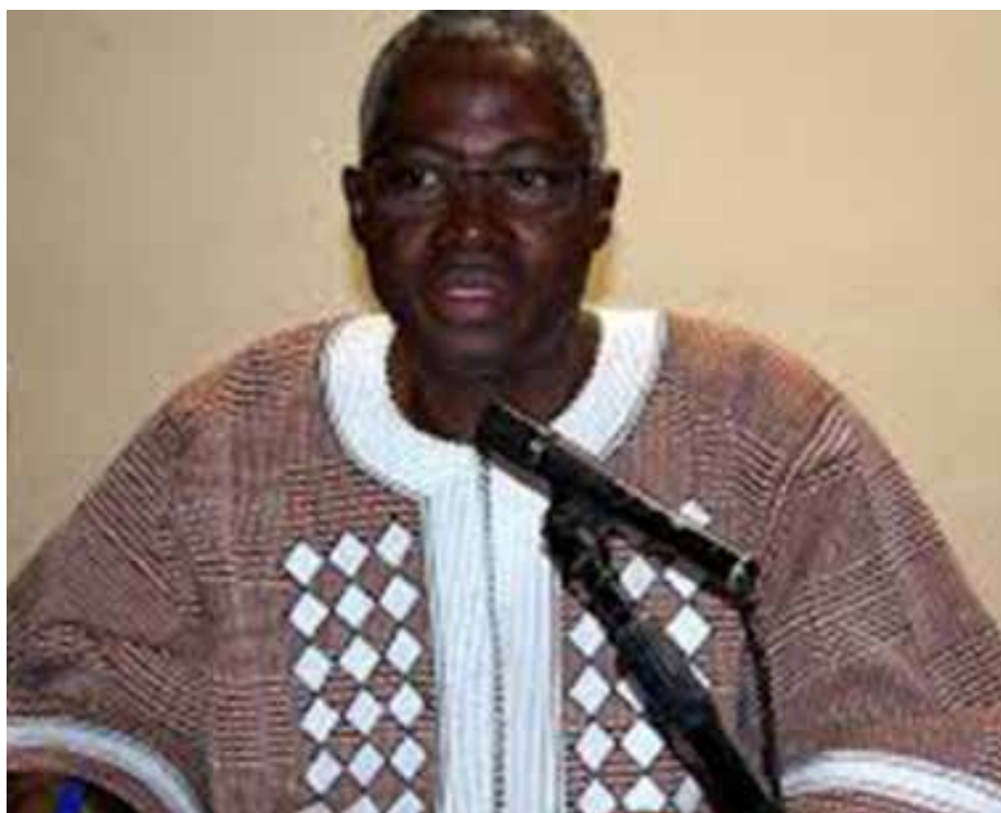
Le ministre de l'Éducation nationale.

1) La plateforme revendicative des syndicats qui nous a été transmise à l'occasion de la journée mondiale des enseignants célébrée chaque année le