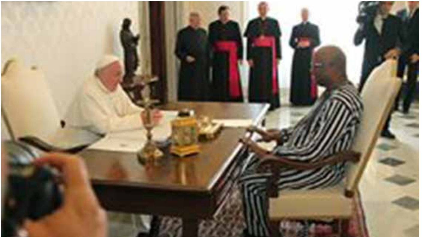
Le Président du Faso, discutant avec le Pape.

Roch Marc Christian KABORE a aussi exprimé au Souverain pontife, la gratitude du Burkina Faso pour l'ensemble des actions de l'Eglise, mais aussi et surtout pour les pensées pieuses et les prières dites à l'endroit de notre pays durant les moments de crises. Le Pape François a salué le dialogue inter-religieux qui aujourd'hui fait la fierté du Burkina Faso. La présence des différentes communautés au Vatican se justifie par l'harmonie qui règne entre elles et permet de montrer au Souverain pontife comment ces communautés vivent en symbiose. Cela a été salué aussi bien par le Cardinal secrétaire d'Etat que par le Pape François. L'audience pontificale du chef de l'Etat burkinabè a pris fin par un change de cadeaux et la photo de famille.