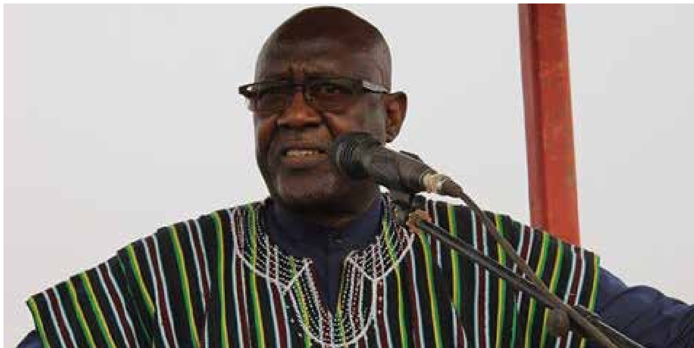
Le ministre de l'agriculture et des aménagements hydrauliques.

agricoles issues des exploitations familiales pour accroître leurs revenus et créer des conditions favorables à leur sécurité alimentaire et nutritionnelle ; • La vente des céréales à prix social et la réalisation d'actions diverses de mise à disposition de vivres aux ménages vulnérables .