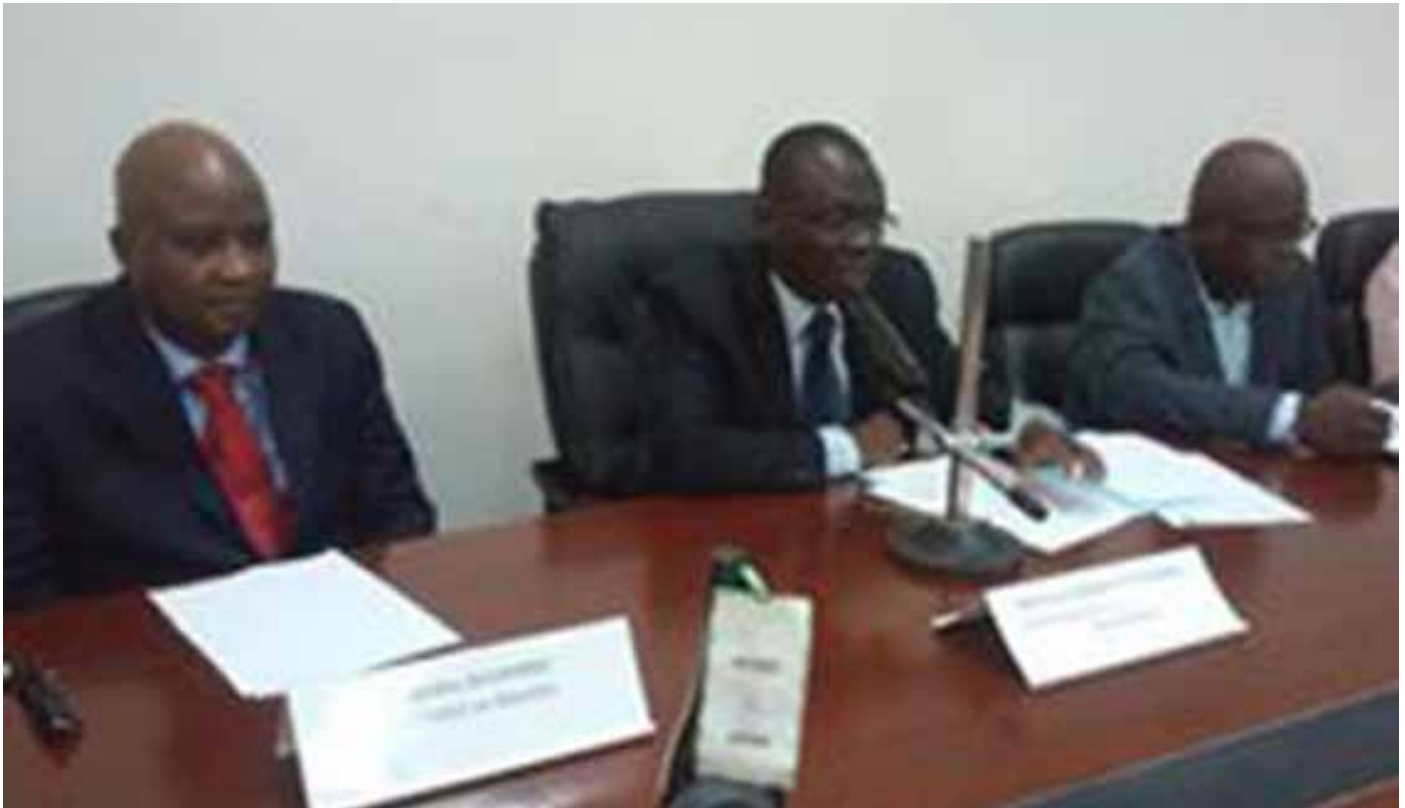
Le ministre de la justice, garde des sceaux au milieu.

L a première session de l'université judiciaire du Barreau s'est tenue le vendredi 21 octobre 2016, à la Maison de l'avocat sis au Palais de Justice de Ouagadougou. La cérémonie d'ouverture de cette session placée sous le thème : « la présence de l'avocat en enquête préliminaire », a été présidée par le Ministre de la Justice, des Droits humains et de la Promotion civique, Garde des Sceaux, Bessolé René BAGORO.