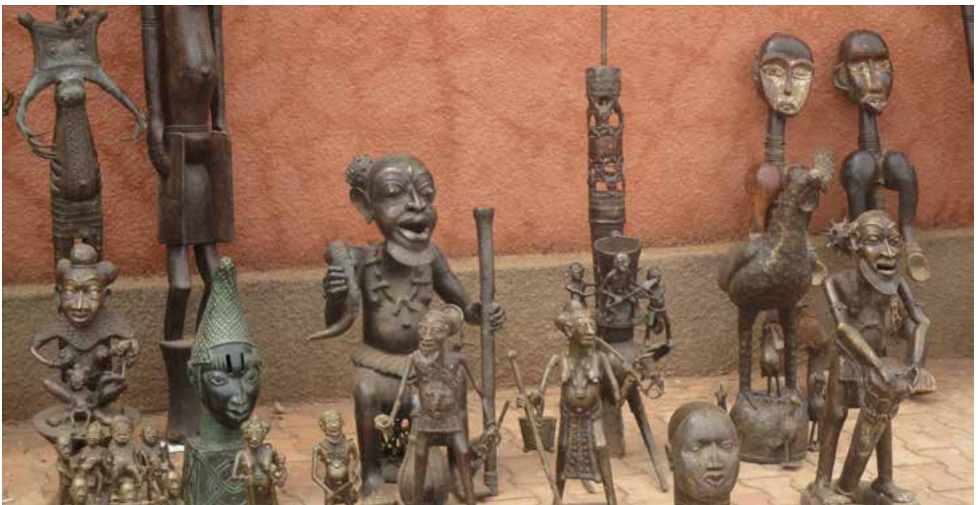
Oeuvres d'art exposées devant le pavillon du Soleil Levant.