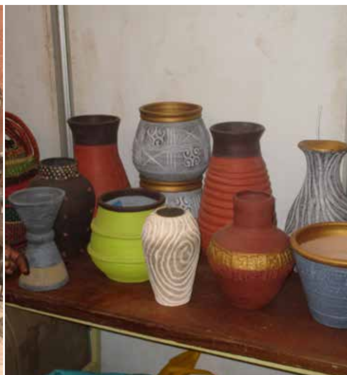
Oeuvres d'art exposées au SIAO.