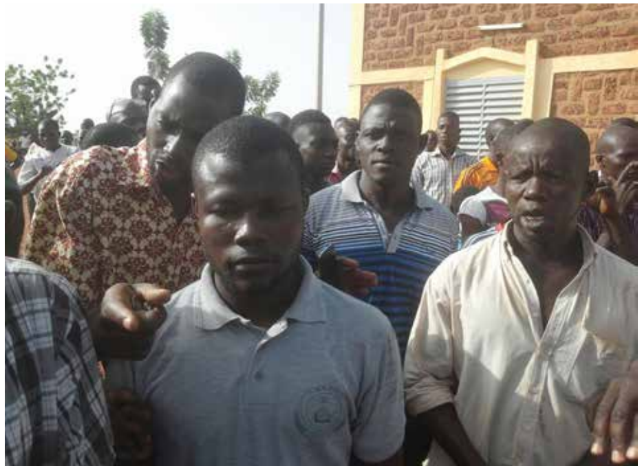
Marche (représentant osc en t-sirt gris).