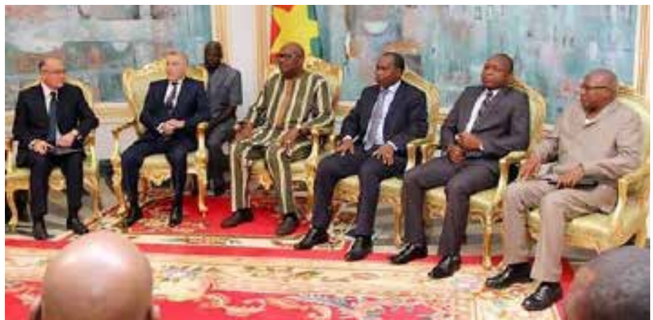
La délégation de l'Azerbaïdjan en audience avec le Président du Faso.

Aujourd'hui, nous avons réussi à élever le niveau de vie de notre population en si peu de temps. Nous avons transformé le niveau de vie à un niveau de standard international. J'ai