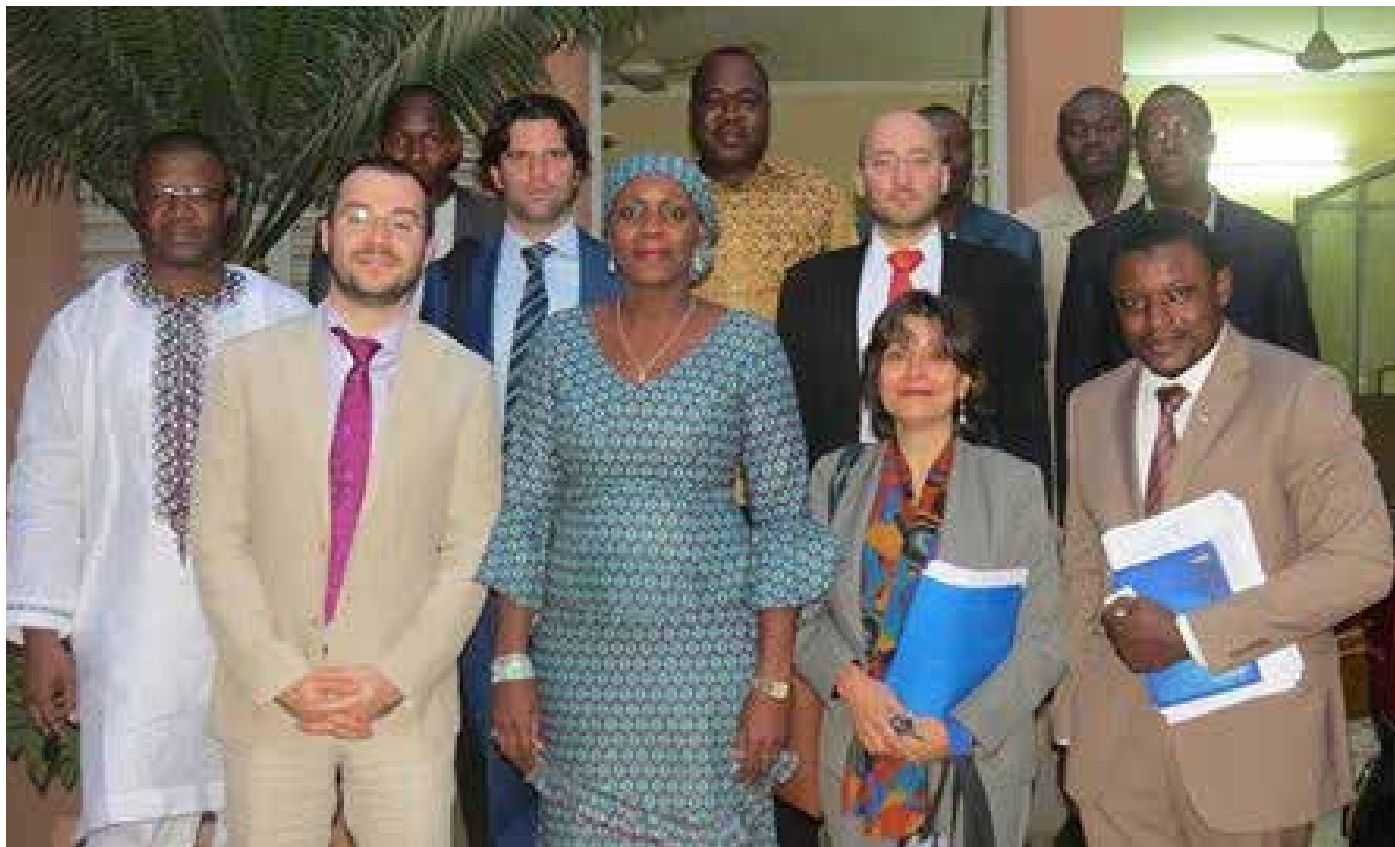
Photo de famille.