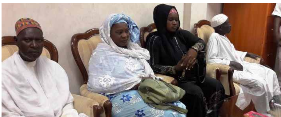
La ligue islamique chez le ministre d'Etat.

La Direction de la Communication et de la Presse Ministérielle du MATDSI