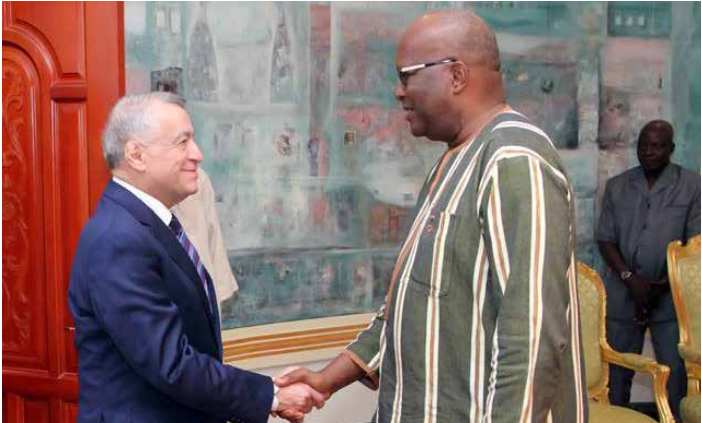
Le Ministre de l'Industrie et de l'énergie de l'Azerbaïdjan reçu par le Président du Faso.

L'Azerbaïdjan veut investir dans le domaine électrique au Burkina P.6