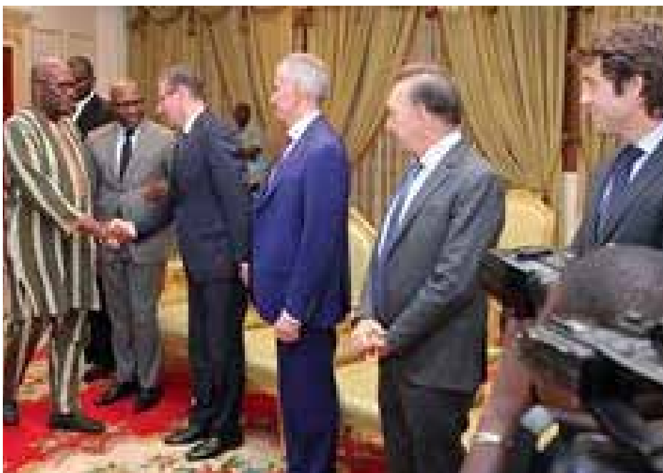
La délégation de l'Azerbaïdjan recue par le Président du Faso.

Au sujet de ce partenariat, le ministre azerbaïdjanais a confié avoir parlé d'énergie avec le chef de l'Etat. « Nous avons tous convenu que l'énergie électrique est la clé de voûte du développement. Aujourd'hui, sans énergie, aucun développement économique et social n'est possible. C'est pour cela que nous avons proposé nos services car nous avons une grande expérience en la matière. Nous allons le faire grâce aux investissements des sociétés burkinabè et azerbaïdjanaises. Ces sociétés sont étatiques et l'Etat les soutient fermement. Il y a de nombreux projets que nous voulons