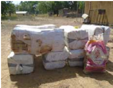
600 kg de cannabis saisi.

La Direction Générale des Douanes est chargée de l'élaboration et de l'application des lois et règlements douaniers et de la perception des droits et taxes y afférent. Ces actions se regroupent en trois missions essentielles qui sont les missions fiscales, économiques et le concours à d'autres administrations. C'est dans ce cadre que les agents des douanes de Nako, dans leur patrouille ont pu