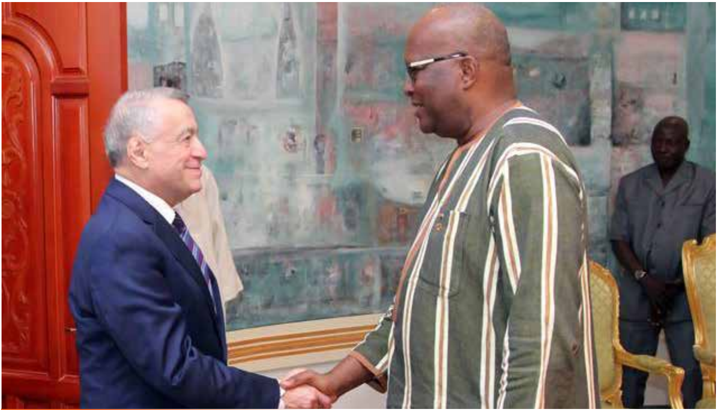
Le ministre de l'Industrie et de l'énergie de l'Azerbaïdjan reçu par le Président du Faso.