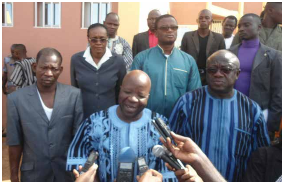
Le ministre Simon COMPAORE s'est prêté aux questions des journalistes.

Des sous thèmes seront également animés dans les trois provinces de la