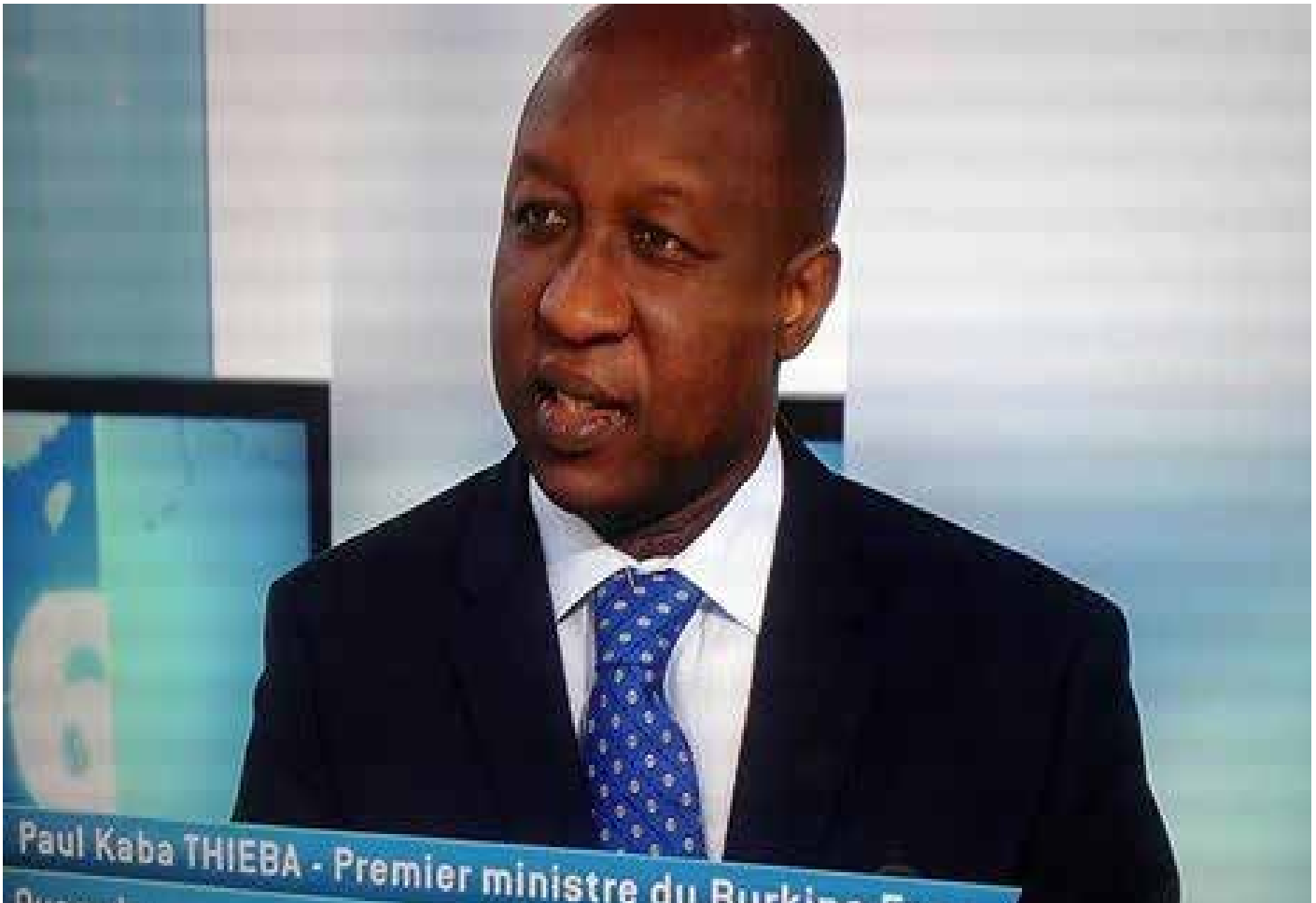
Le Premier Ministre Paul Kaba THIEBA.

Le Premier Ministre était l'invité de la télévision TV5, ce mardi 06 décembre 2016 à 18h10, heure de Paris. Pendant une dizaine de minutes, Paul Kaba THIEBA a répondu en direct aux questions du journaliste sur l'actualité nationale avec en toile de fonds, la tenue de la conférence des partenaires du Burkina Faso sur le financement du PNDES demain dans la capitale française.