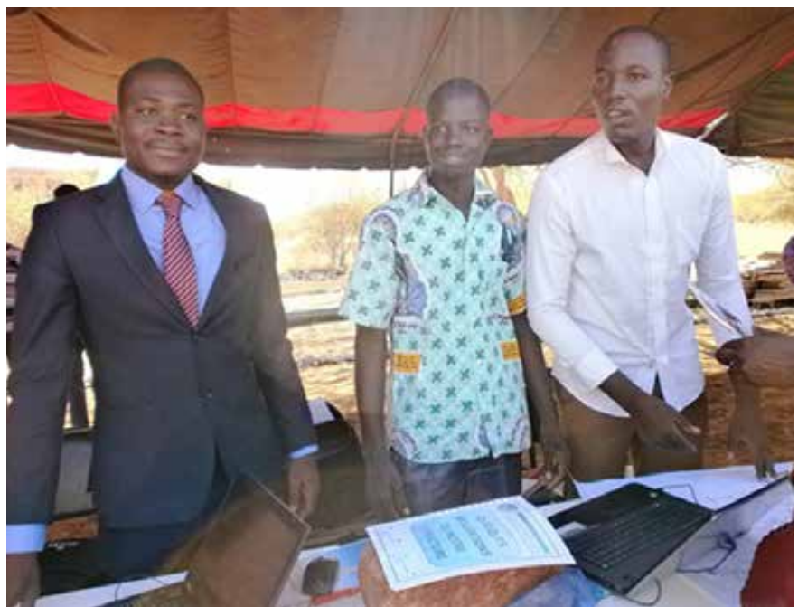
Les anciens étudiant de l'ESPK.