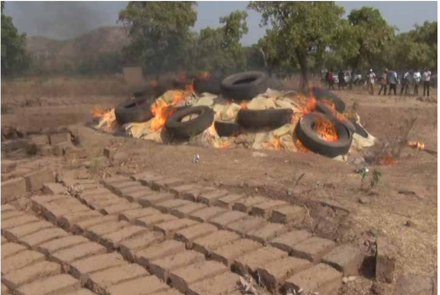
Le riz insunéré.

La brigade des douanes de Nadiagou dans la province de Kompienga a procédé ce 05 décembre 2016 à l'incinération de 38,15 tonnes de riz impropre à la consommation humaine et animale