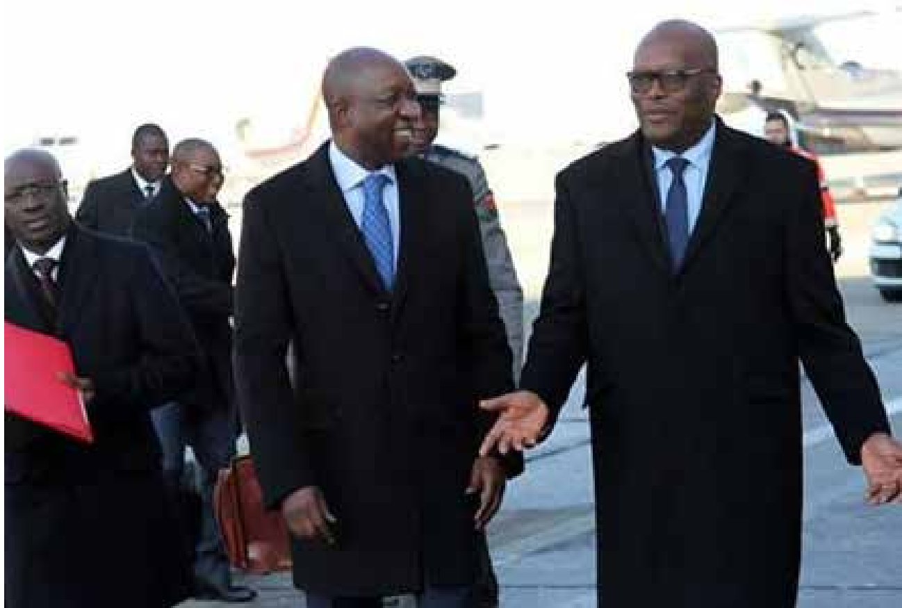
L'arrivée du Président du Faso à Paris.

Autorisation officielle n° 1238/2016/CAO/TGI.OUA/P.F.