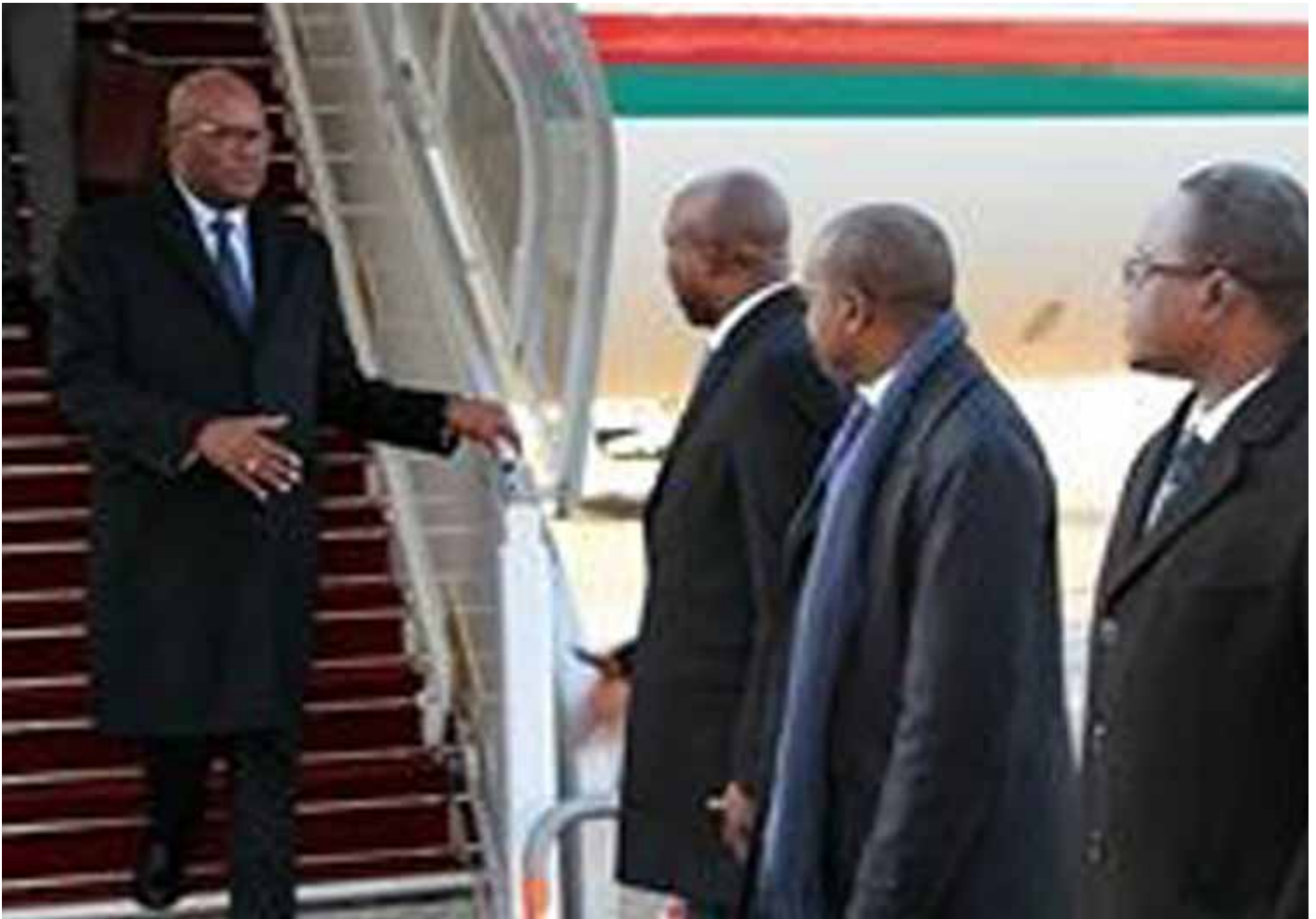
Arrivée du Président du Faso à Paris.

Le Président du Faso, Son Excellence Monsieur Roch Marc Christian KABORE est arrivé à Paris le 06 décembre 2016 pour présider la Conférence des Partenaires du Burkina pour le financement du Plan national de développement économique et social (PNDES).