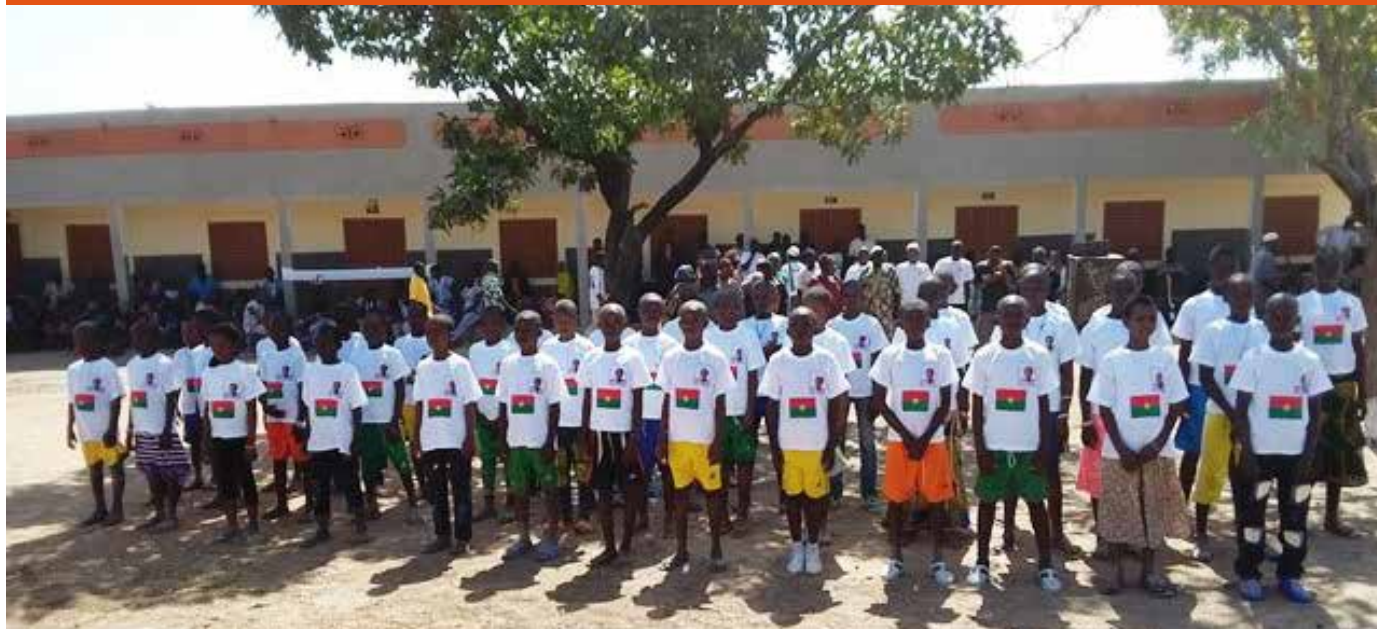
Les élèves de l'école de Betieissan.