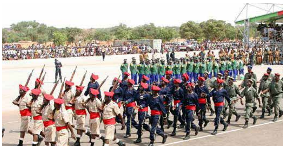
Célébration du 11 décembre à Kaya.