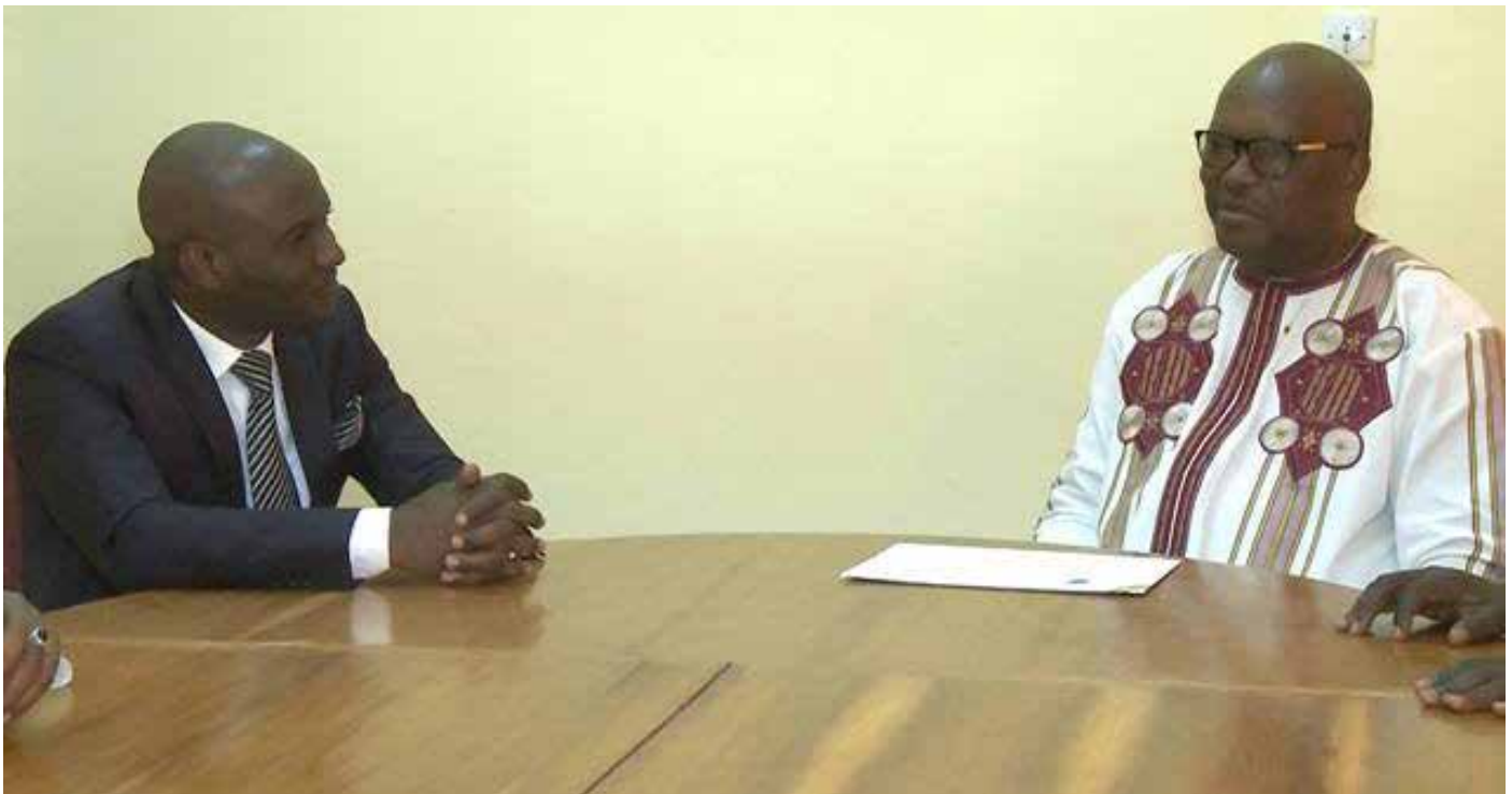
Le Président du Faso avec son hôte.