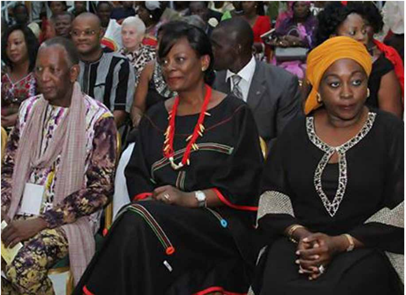
Le Première Dame en compagnie de stylistes de renom.

P résente à Kaya pour prendre part à la célébration du 56e anniversaire de l'indépendance du Burkina Faso, l'épouse du Président du Faso, Madame Sika KABORE, a présidé une cérémonie de défilé de mode internationale dans la soirée du samedi 10 décembre 2016.