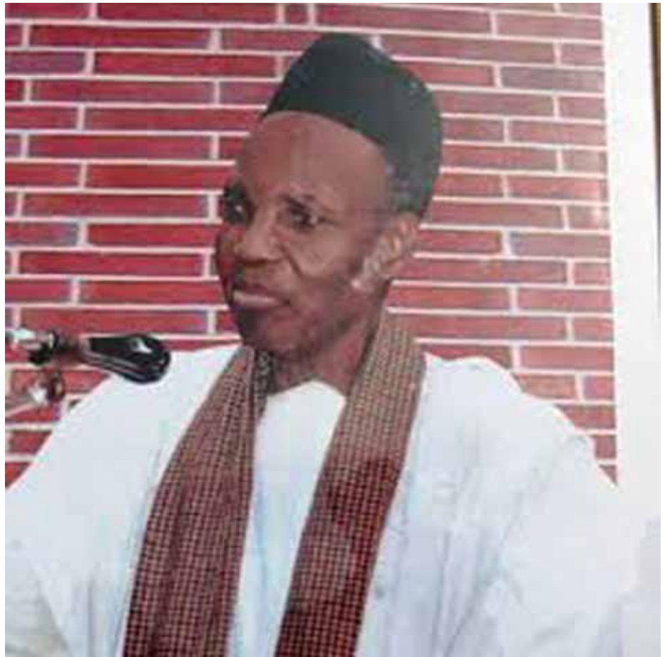
Pr Joseph KI-ZERBO.

En Rappel Joseph KI-ZERBO est né le 21 Juin 1922 à Toma et décédé le 04 décembre 2006 à Ouagadougou. Il est le premier africain agrégé d'histoire à la Sorbonne dans les années 50. Très