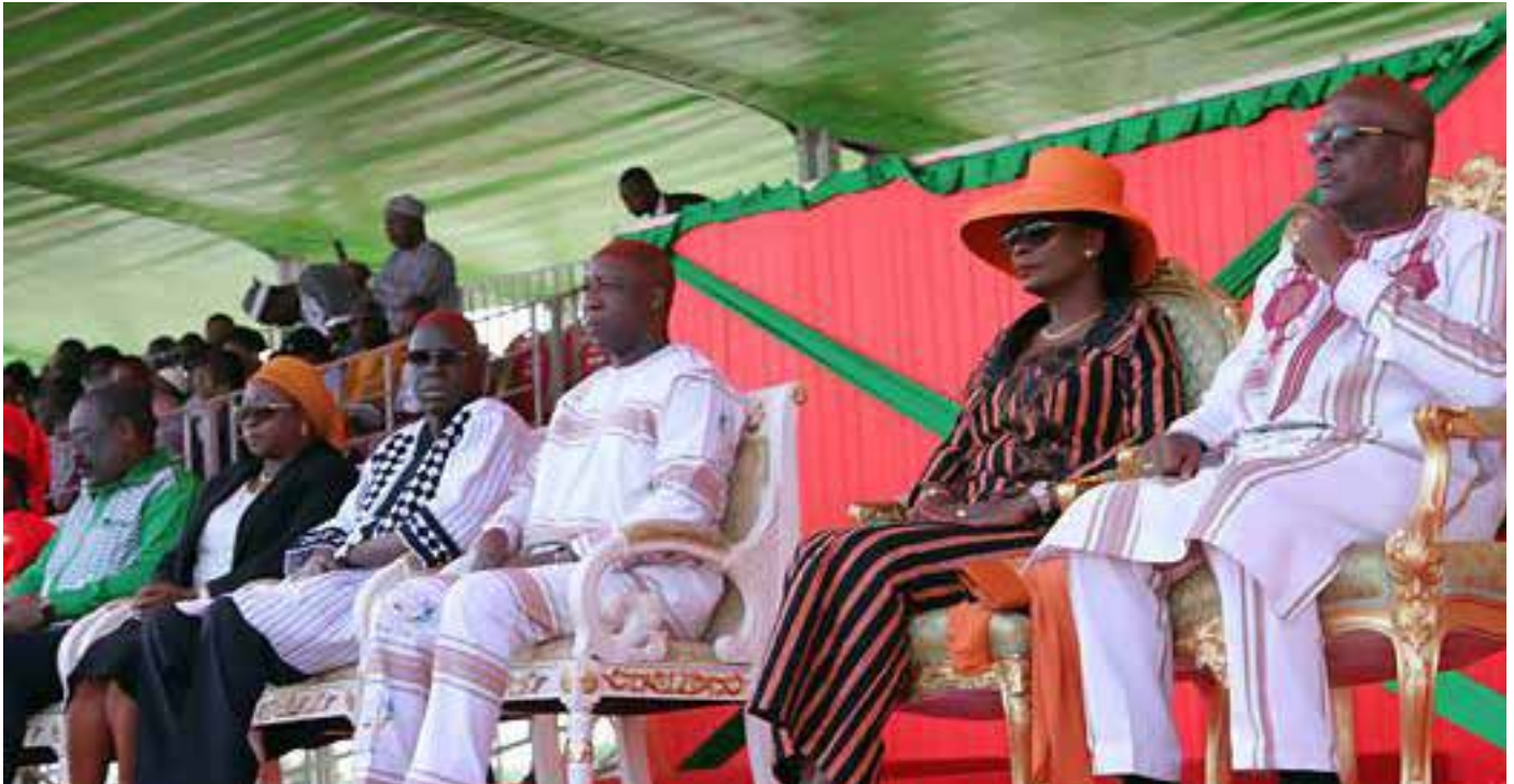
Célébration du 11 décembre à Kaya.

L a célébration du 56e anniversaire de l'indépendance de notre pays a connu son point d'orgue le dimanche 11 décembre 2016 à Kaya. Son Excellence Monsieur Roch Marc Christian KABORE a présidé, pour la première fois en tant que chef d'Etat, la parade militaire et civile, en présence du premier ministre, du président de l'Assemblée nationale, du chef de file de l'opposition politique, des membres du gouvernement, des présidents d'institutions et de nombreuses personnalités de marque. La population de la ville hôte a marqué d'une pierre blanche, sa présence à cette importante cérémonie nationale, démontrant ainsi son intérêt pour la fête nationale et son sens élevé du patriotisme.