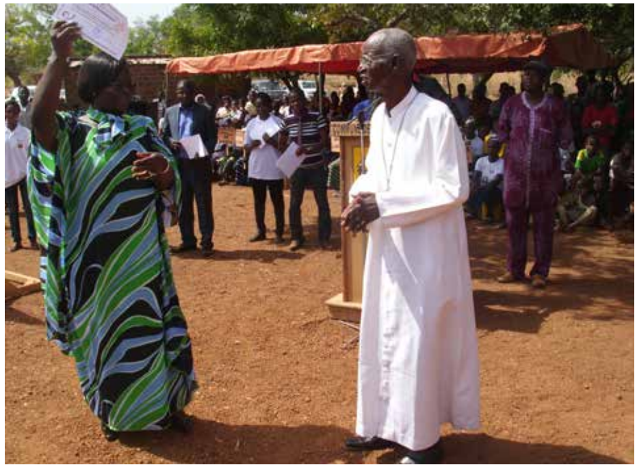
Remise d'attestation de reconnaissance à l'Évêque Émérite Jean Baptiste SOME.