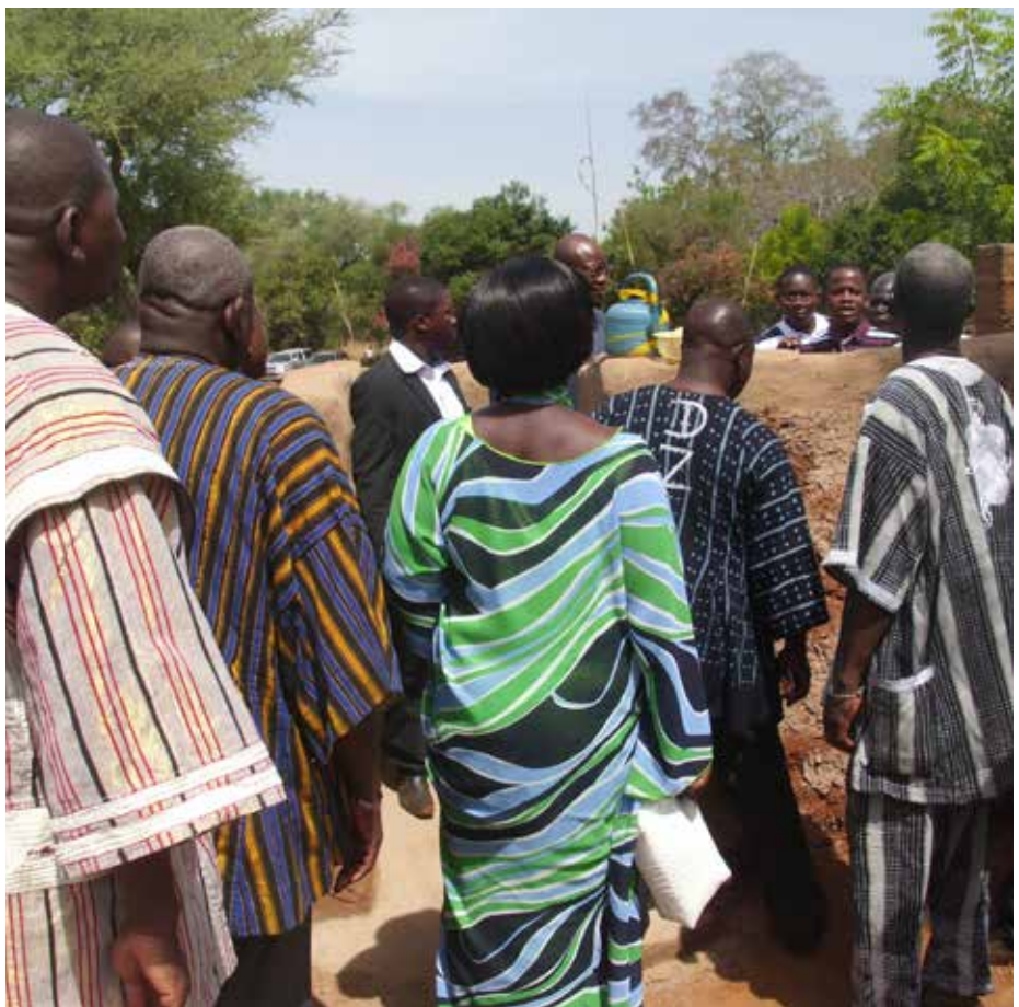
Visite de latrines par les autorités.