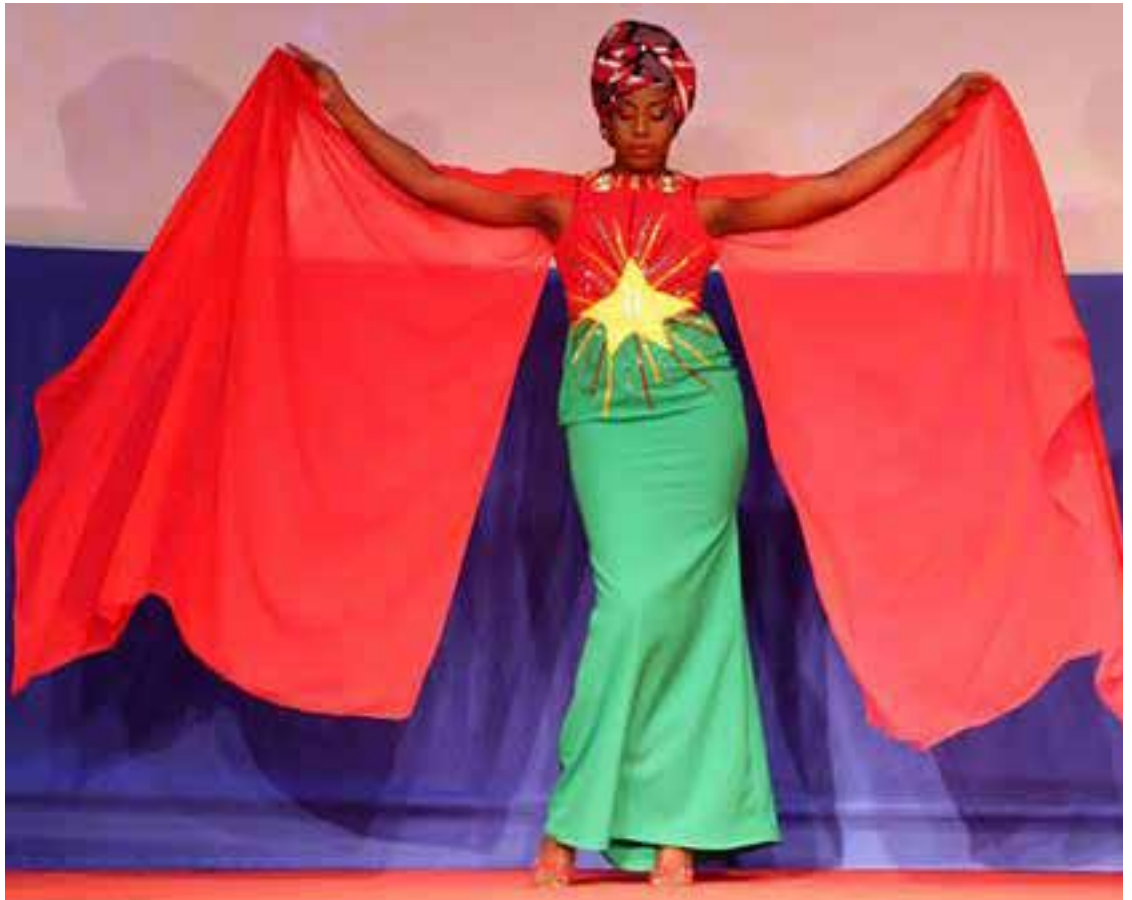
Défilé de mode.

La Direction de la Communication de la Présidence du Faso