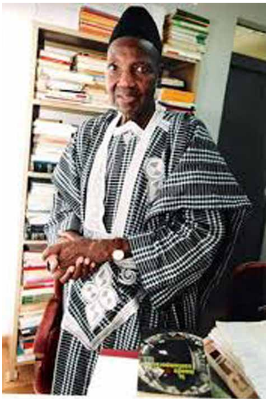
Pr Joseph KI-ZERBO.

Parmi les activités prévues il y aura entre autres : Une exposition photographique sur la vie de l'éminent historien intitulée : Un homme, une vision, et plusieurs combats, se déroulera du 2 au 11 décembre à L'Université Ouaga1, Joseph KI-ZERBO. Cette exposition retrace