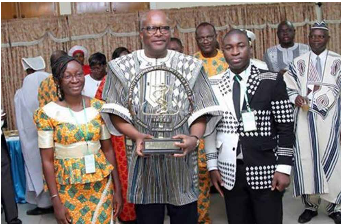
Célébration des 10 ans de l'INSSA à Bobo.

L' INSSA de Bobo-Dioulasso célèbre ses 10 ans sous la présidence du chef de l'Etat. L'Institut Supérieur des Sciences de la Santé (INSSA) a ouvert ce lundi 19 décembre 2016, à Bobo-Dioulasso, les festivités commémoratives de ses 10 années d'existence, en présence du Président du Faso, Son Excellence Monsieur Roch Marc Christian KABORE.