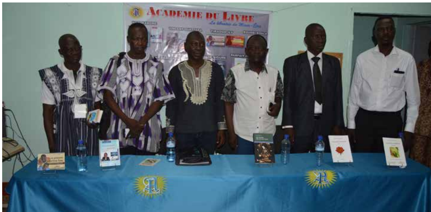
Les écrivains burkinabè ont répondu présents avec leurs œuvres.