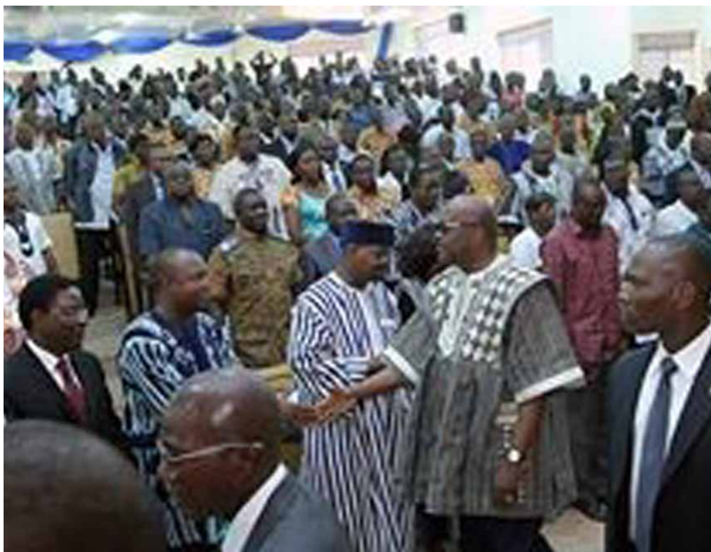
Le Président du Faso, saluant les officiels.

d'une aire d'exposition thématique. Face à la communauté universitaire, le Président du Faso a réaffirmé son engagement à inscrire l'enseignement supérieur au rang des priorités nationales et à travailler à garantir une bonne gouvernance administrative et financière des universités burkinabè. Le chef de l'Etat a exprimé la disponibilité de son gouvernement à renforcer le potentiel des infrastructures d'accueil et l'équipement technique et informatique des temples du savoir que sont nos universités. Il a également annoncé le soutien de l'Etat à l'amélioration des conditions d'études et de travail des étudiants, des enseignants et du personnel administratif