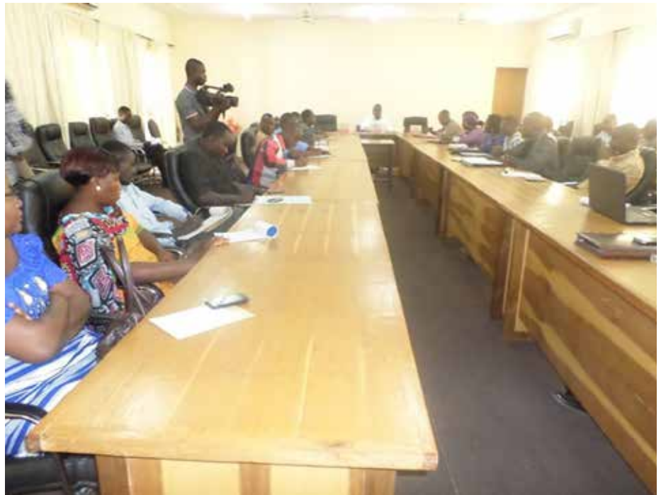
Les participants à l'Assemblée Générale.

Le Ministère de l'Éducation nationale et de l'Alphabétisation(MENA) a organisé conjointement avec le Ministère en charge de la Sécurité et le Ministère en charge des Enseignements supérieur, une Assemblée générale du Conseil national pour la Prévention de la Violence à l'École(CNPVE), les 8 et 9 décembre 2016, à Loubila sous le thème : «renforcement institutionnel du CNPVE : acquis et perspectives».