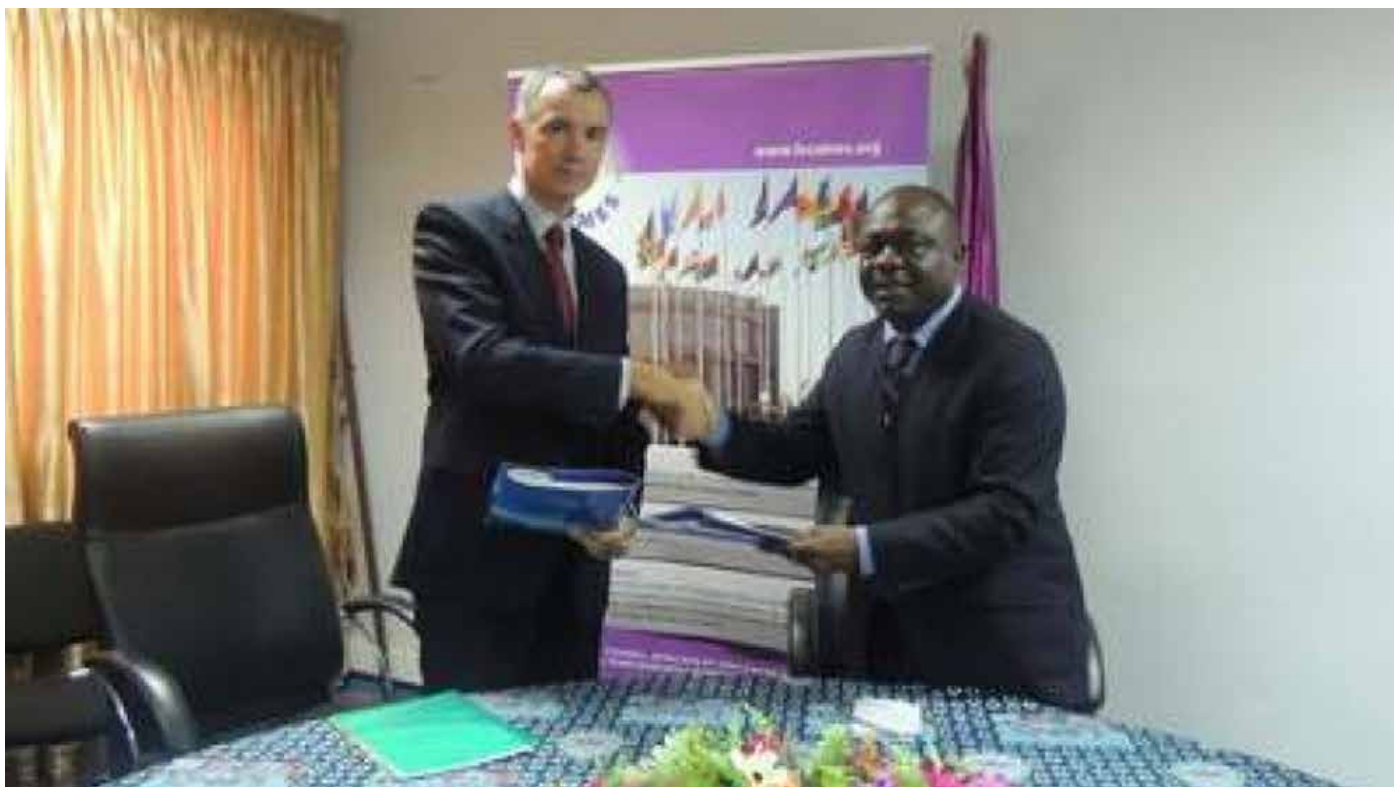
Signature d'accord de partenariat.

E n 2014, le Comité international de la Croix-Rouge (CICR) et le Conseil africain et malgache pour l'enseignement supérieur (CAMES) avait signé un accord pour l'enseignement universitaire de la chirurgie de guerre.