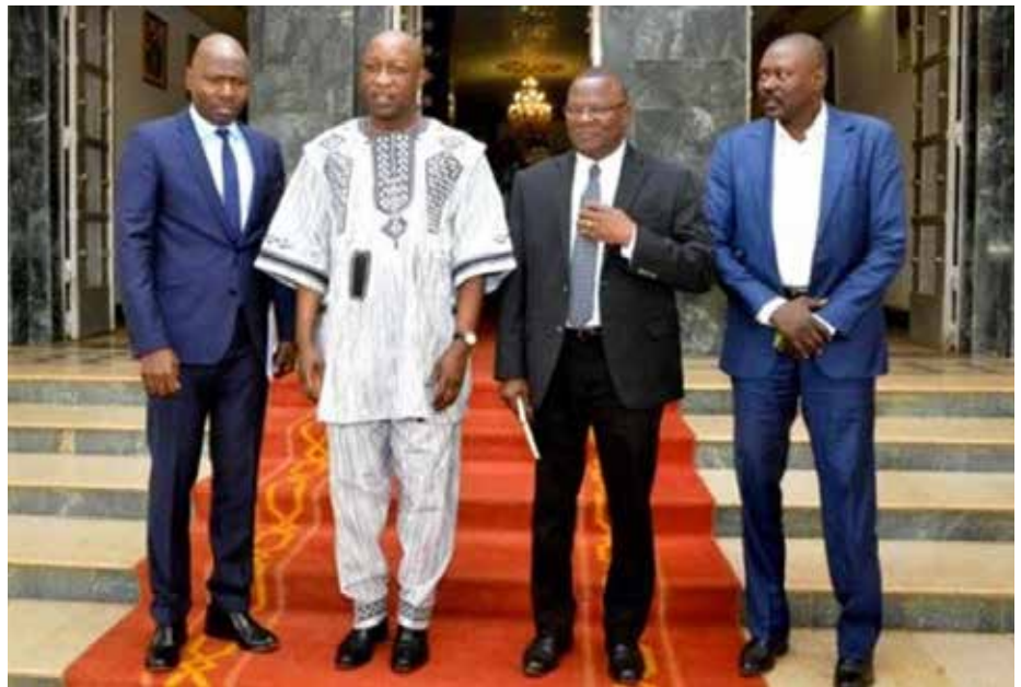
Photo de famille du Premier Ministre avec ses hôtes.

Dans son programme National de Développement Economique et social (PNDES), le gouvernement prévoit de rendre accessibles les soins de santé à tous les Burkinabè. C'est un programme que les bailleurs de fonds