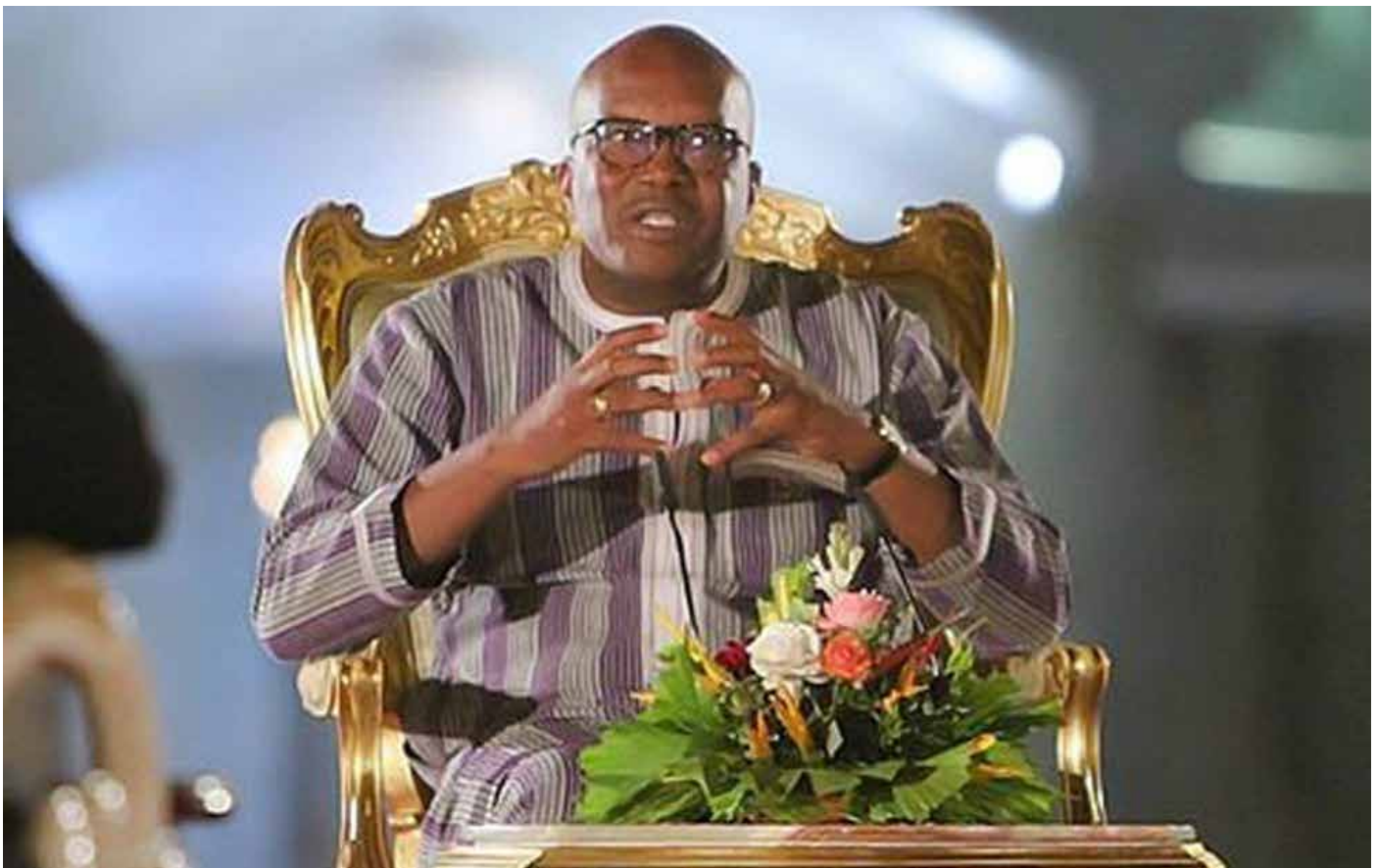
Le Président du Faso face à la presse.

2 9 décembre 2015-29 décembre 2016 : un an que le Président Roch Marc Christian KABORE est à la tête du Burkina Faso. A cette occasion, il s'est entretenu en direct avec une dizaine de journalistes de la presse nationale du Burkina Faso dans la soirée du jeudi 29 décembre 2016 pour faire le bilan détaillé de sa gestion des affaires au sommet de l'Etat. L'entretien depuis le palais présidentiel à Ouaga 2000 a été retransmis en direct sur les différentes chaînes de télévisions