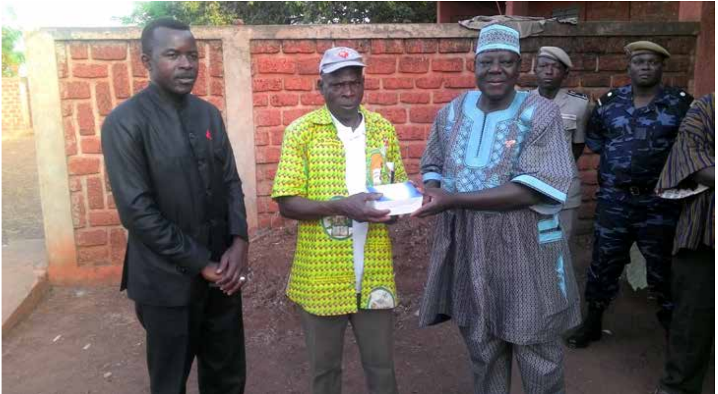
Remise d'un lot de médicaments .