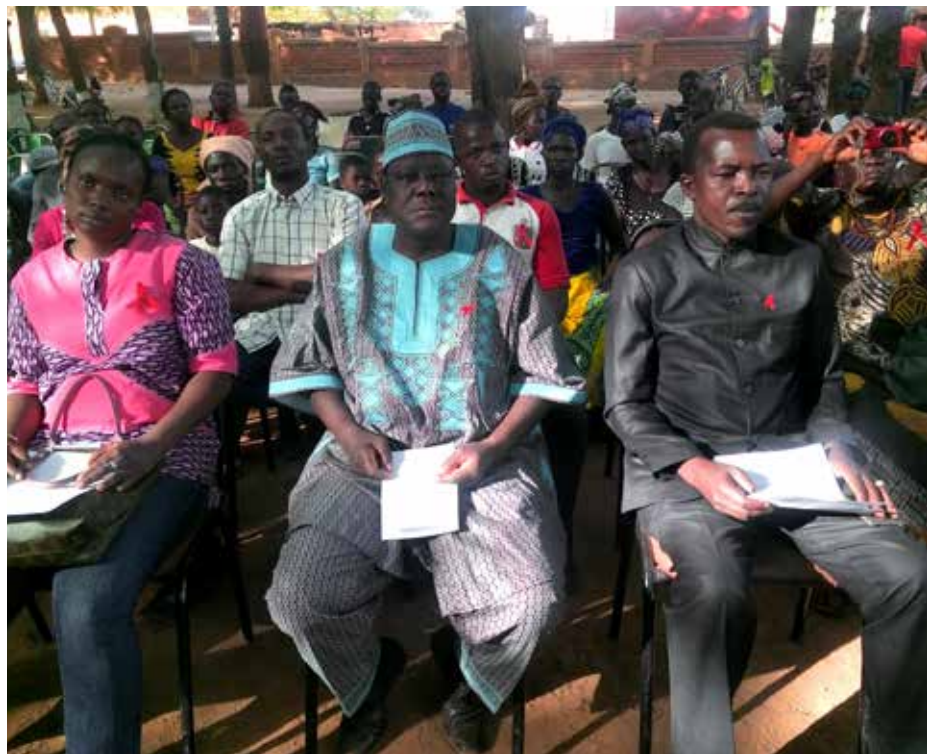
Vue de l'assistance à la cérémonie commémorative.

tout un chacun à ne pas baisser la garde.