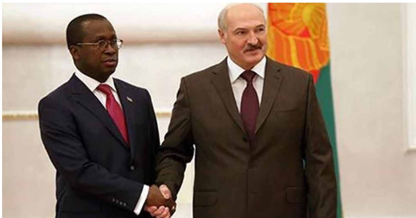
L'ambassadeur du Burkina présentant ses lettres de créance.