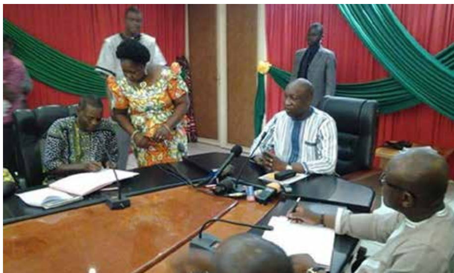
La signature du protocole d'accord.

Par ailleurs, Gouvernement et SYNATIC sont tombés d'accord sur la transformation des Etablissements publics de l'Etat (EPE), RTB et Editions Sidwaya en sociétés d'Etat.