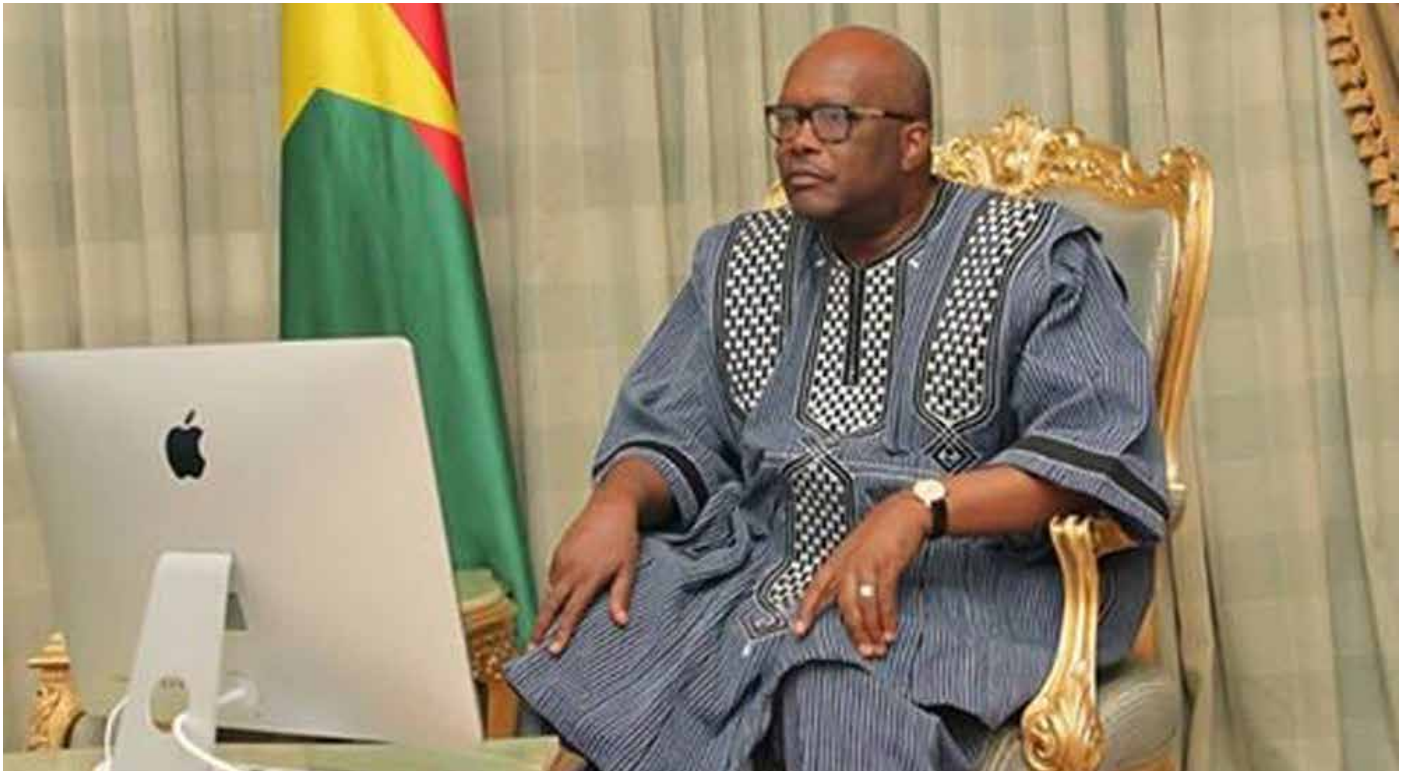
Le Président du Faso.

M ercredi 28 décembre 2016, en début de soirée, le Président du Faso, Son Excellence Monsieur Roch Marc Christian KABORE avait rendez-vous sur Twitter avec les internautes pour discuter des actions fortes engagées par le gouvernement, un an après son arrivée au pouvoir.