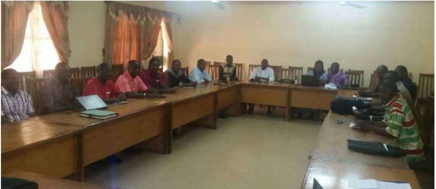
Les responsables des différentes structures syndicales.

L es vingt-sept et vingt-neuf décembre 2016, s'est tenu, dans la salle de conférences du centre d'accueil l'Abbé Pierre de Koudougou, le troisième conseil syndical statutaire du SYNADEC BF.