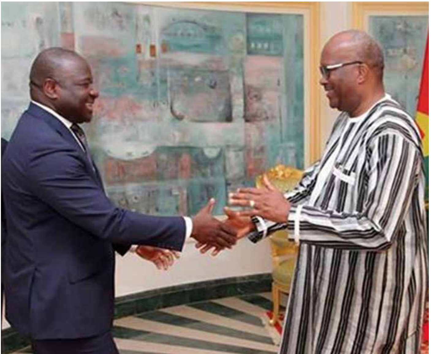
Lassina ZERBO reçu par le président du Faso.

L e Président du Faso, Son Excellence Monsieur Roch Marc Christian KABORE, a reçu en audience en début d'après-midi du vendredi 6 janvier 2017, le Secrétaire exécutif de l'Organisation du Traité d'Interdiction Complète des Essais nucléaires (OTICE), le Docteur Lassina ZERBO.