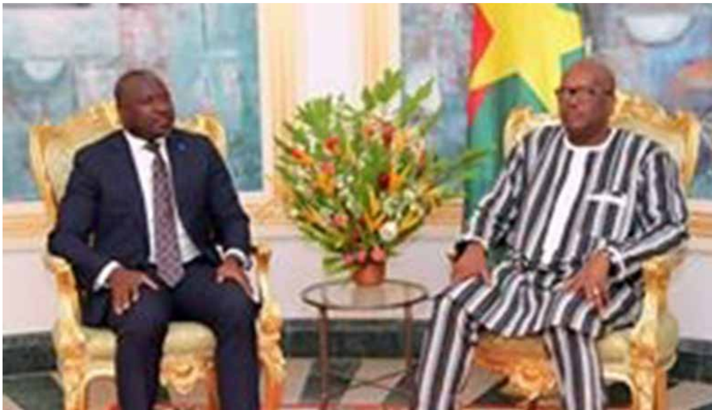
Lassina ZERBO en audience avec le Président du Faso.

au chef de l'Etat pour la nouvelle année en lui réitérant son soutien sur le plan international pour qu'il puisse guider ce pays dans la paix et la sérénité ».