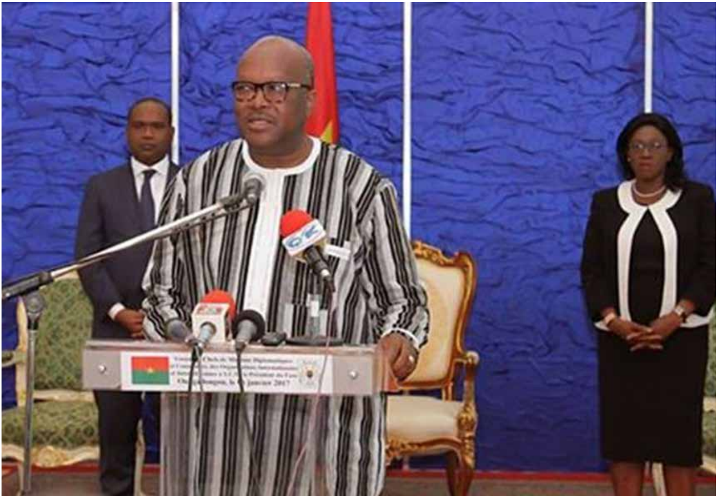
Le président du Faso.