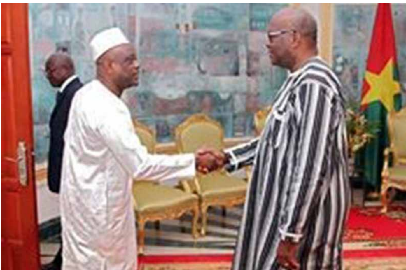
Le Président de la Chambre du Commerce et son équipe chez le Président du Faso.