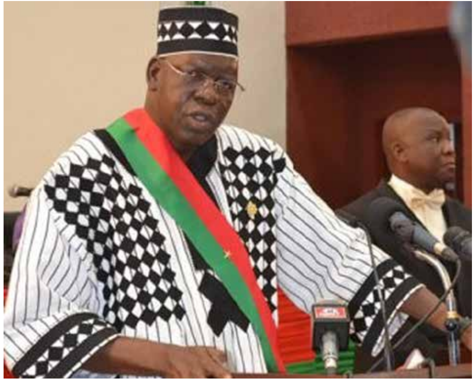
Le Président de l'Assemblée Nationale.

Cette convocation intervient à la demande du Premier ministre, Son Excellence Monsieur Paul Kaba Thiéba. Et ce, conformément à la Constitution en son article 88 qui dispose que l'Assemblée nationale « se réunit en session extraordinaire sur convocation de son Président, à la demande du Premier ministre ou de la majorité absolue des députés (...) sur un ordre du jour déterminé ». Pour déterminer l'ordre du jour de cette première session extraordinaire, la conférence des présidents s'est réunie, le vendredi 08 juillet 2016, à l'Assemblée nationale. Plusieurs points ont été inscrits dans l'ordre du jour. Au cours de la session extraordinaire, il est prévu la présentation du document de programmation budgétaire et économique pluriannuelle (DPBEP)