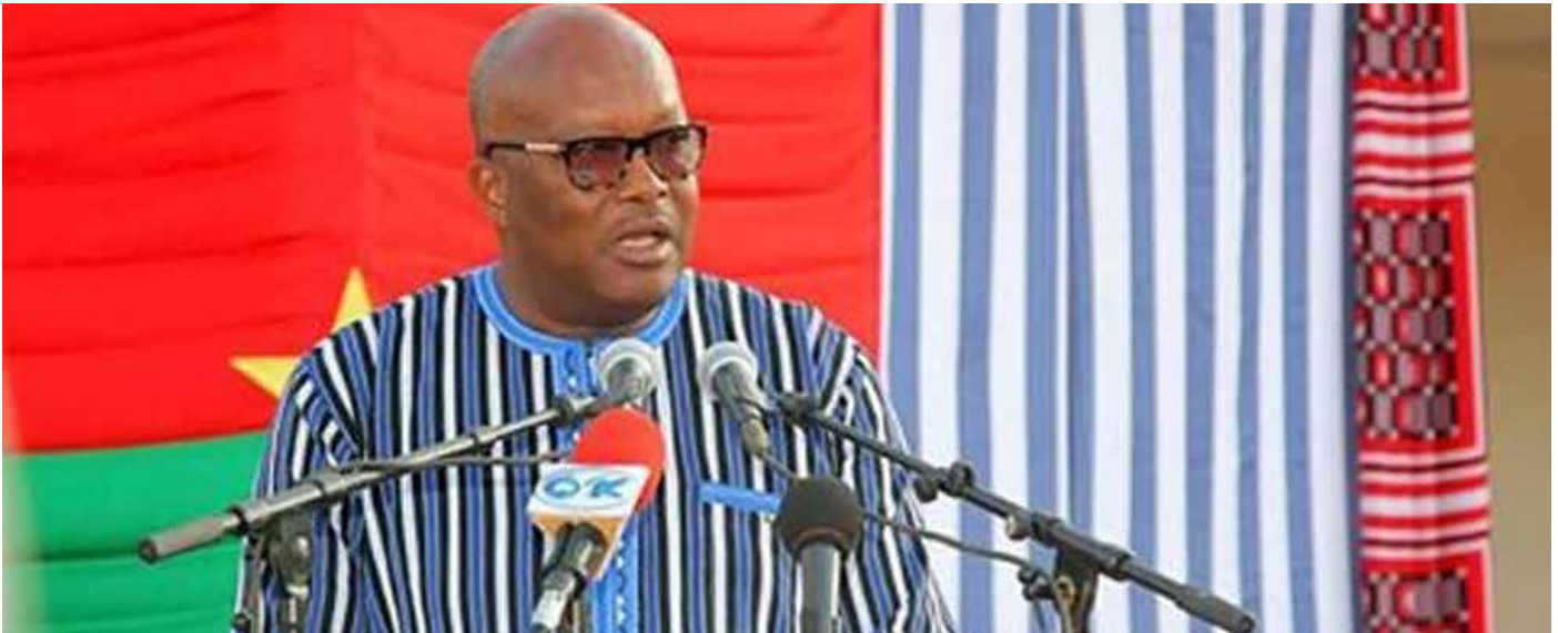
Le Président du Faso.