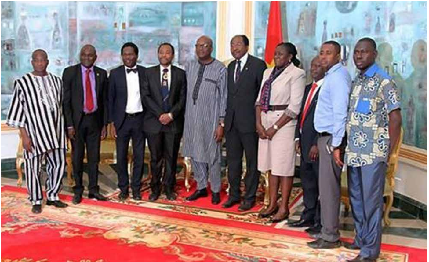
Photo de famille du Président et de ses hôtes.