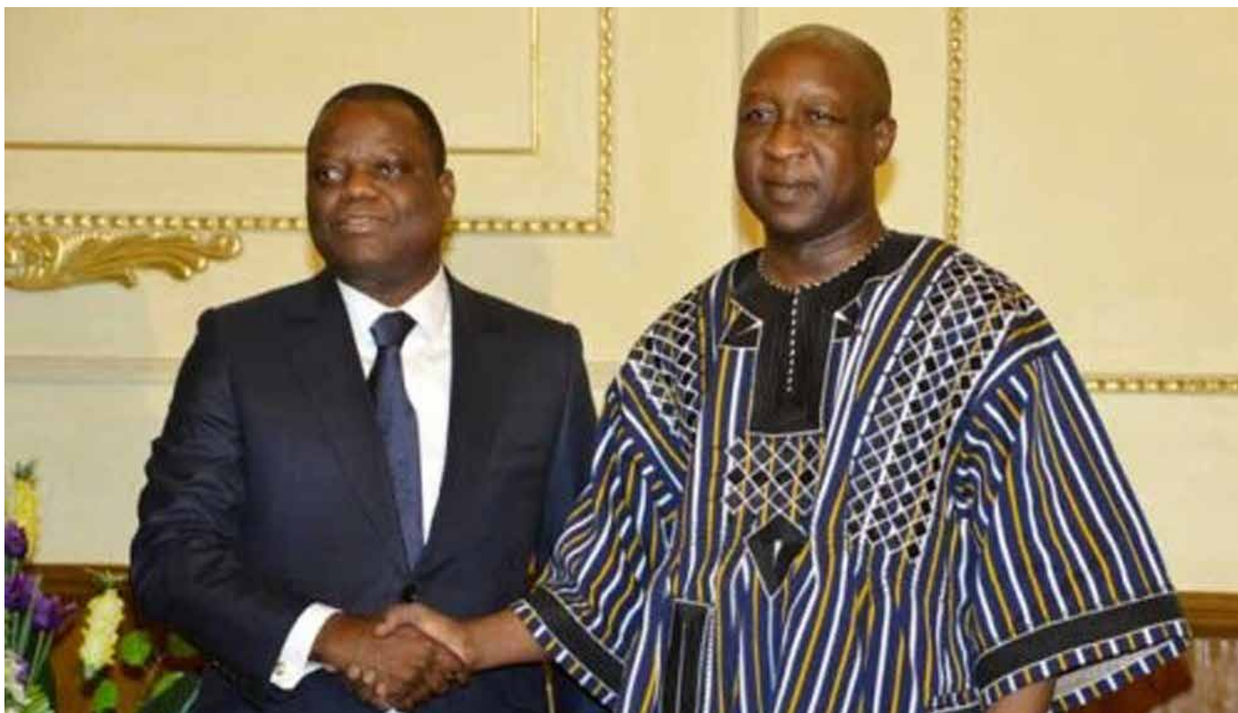
Le Premier ministre Paul Kaba THIEBA.

L e Premier ministre, Paul Kaba THIEBA, a accordé une audience au Président du Patronat béninois, Sébastien G. AJAVON, le lundi 09 janvier 2017. Le patron des patrons béninois et le Chef du Gouvernement ont échangé sur la redynamisation du Partenariat public-privé entre le Burkina Faso et le Bénin. Plusieurs secteurs sont concernés par cette redynamisation notamment l'énergie et l'agriculture.