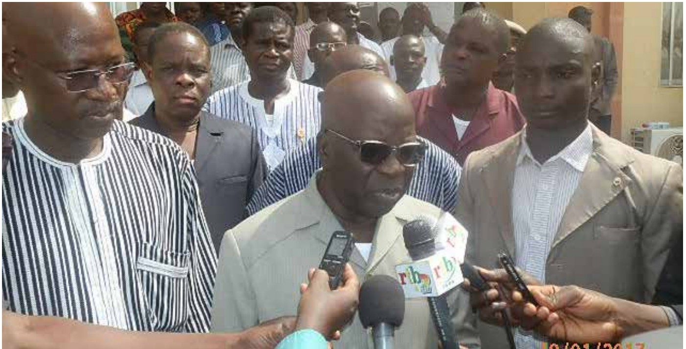
Le Ministre d'Etat, Ministre de l'Administration Territoriale et de la Sécurité Intérieure, Simon Compaoré se prête aux questions des journalistes.