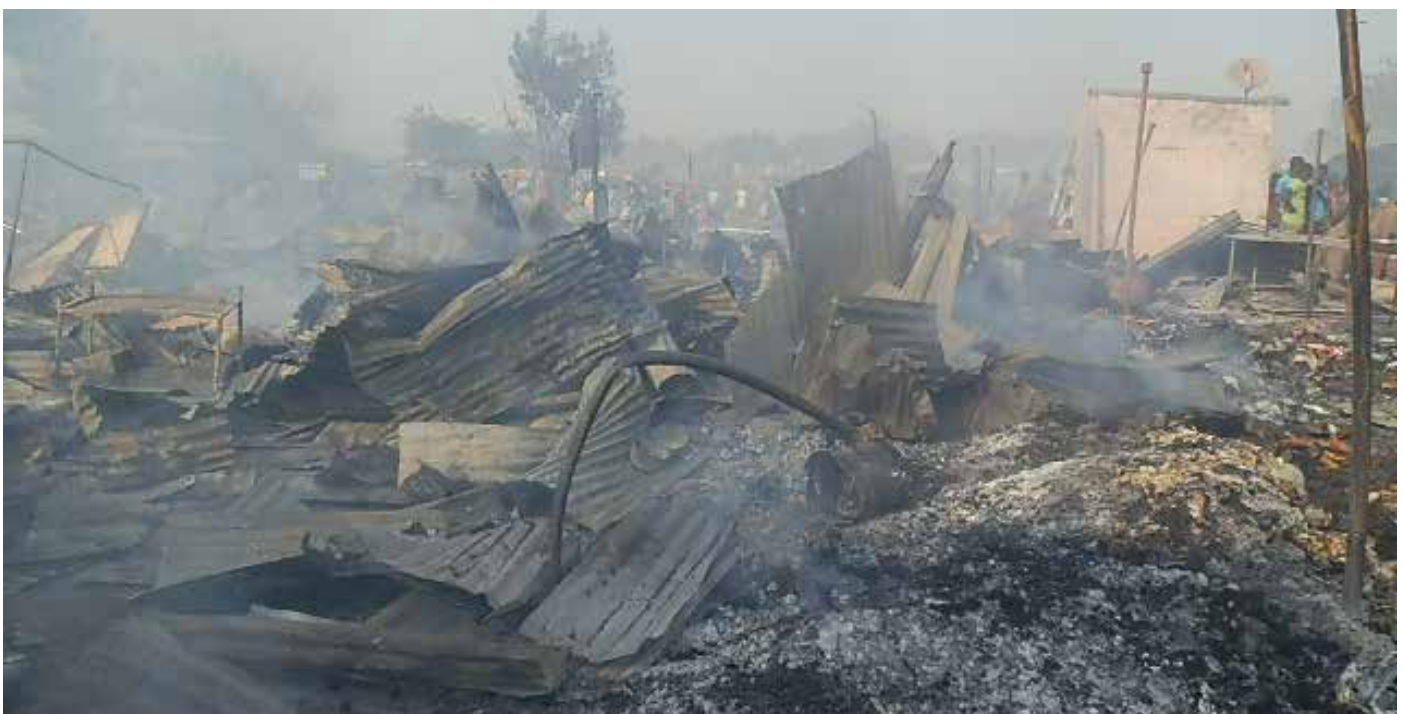
Ce qui reste du marché actuellement.

de la chambre de commerce et quelques représentants des opérateurs économiques en vue de trouver ensemble des solutions pour les difficultés présentes. Compte tenu de ces