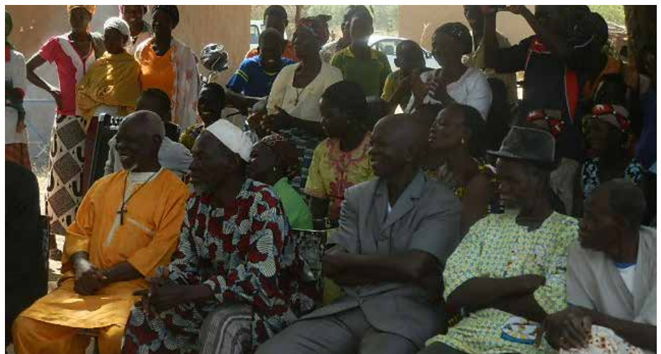
La population de tout âge sortie accompagner l'association dans son initiative.

micro finance et de faire le compte rendu sur les opérations de crédits accordés aux femmes durant les années écoulées. Il s'est agi aussi d'exprimer sa reconnaissance