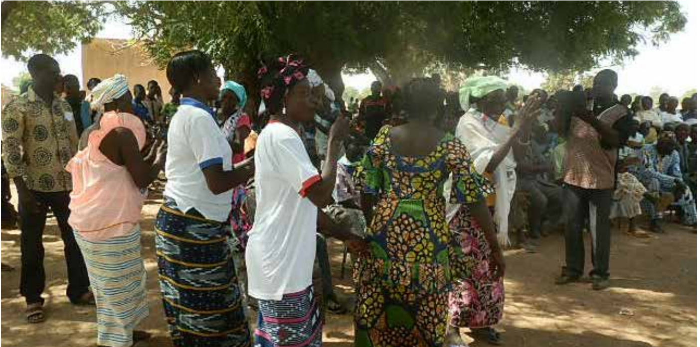
Les femmes en liesse.

A sssemblée générale de l'Association pour le Développement de Yargo (ADVY) et le groupement des jeunes dudit village ce vendredi 20 janvier 2017 dans leur marché. Cette assemblée générale marque la fin d'une campagne d'activités génératrices de revenus.