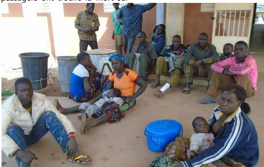
Les blessés au CHR.