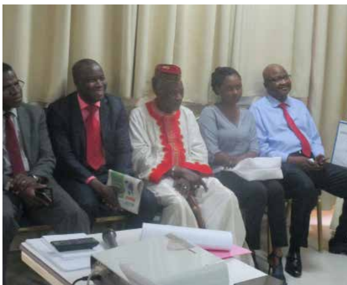
Les doyens du Barreau burkinabè.