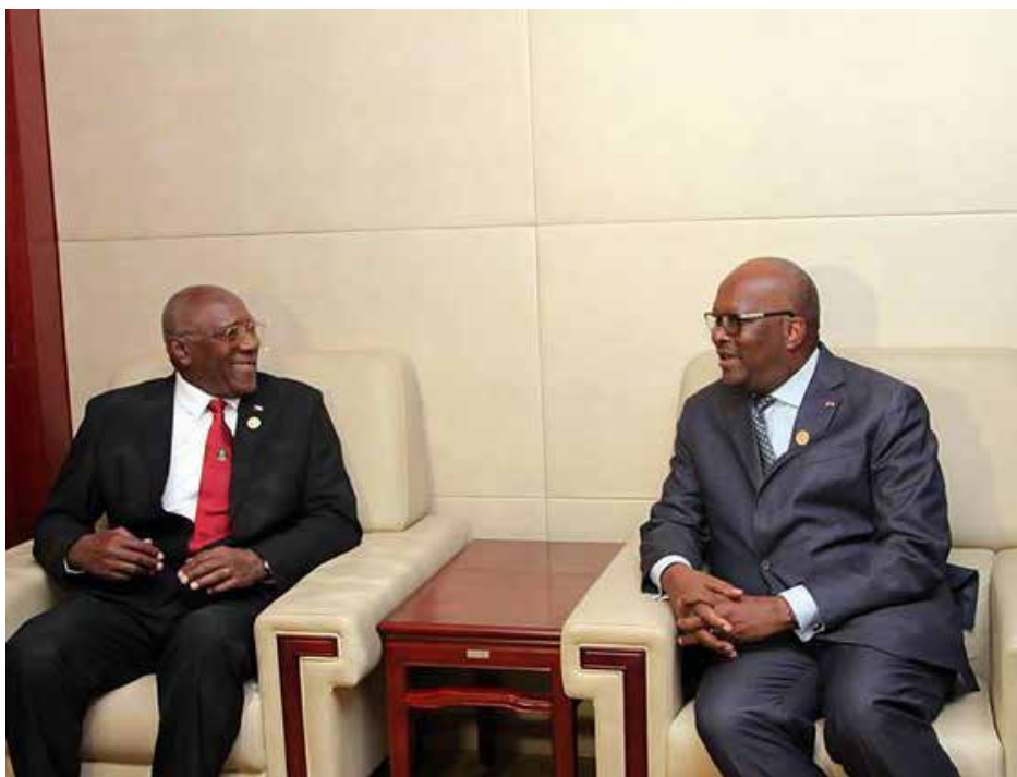
Le Président du Faso échangeant avec son hôte.