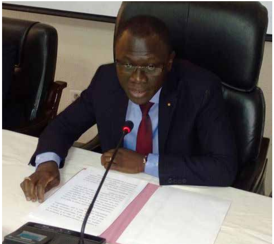
Garde des sceaux.

Malheureusement, ces facteurs ne profitent pas seulement aux entités travaillant dans la légalité. Ils profitent aussi aux criminels qui les utilisent pour commettre des crimes graves dans un Etat et tentent ainsi de se soustraire