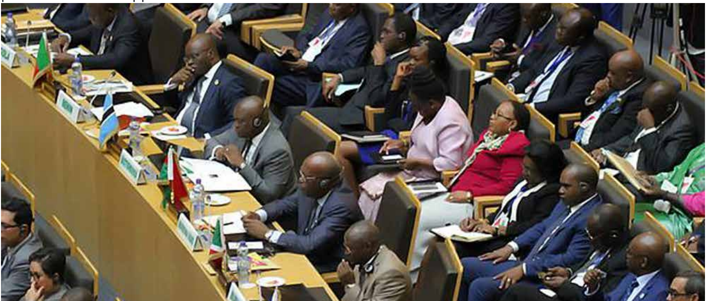
28e Session ordinaire de l'Union africaine.

continent en faisant de sa jeunesse une actrice majeure. Madame Nkosazana Dlamini-ZUMA qui clôture son dernier mandat à la tête de la Commission de l'Union Africaine, a entamé son allocution par un hommage au défunt Président de