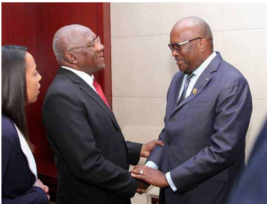
Le Président du Faso recevant son hôte.

La Direction de la Communication de la Présidence du Faso