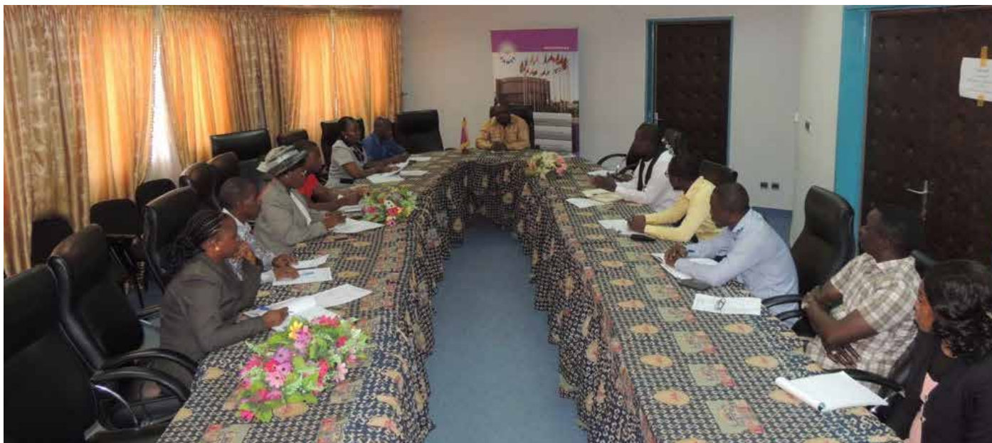
Réunion de travail de l'ensemble du personnel du CAMES.

L e 25 janvier 2017, le Secrétaire général a réuni l'ensemble des personnels du CAMES, pour une réunion de travail visant à élaborer sa stratégie, pour mieux organiser la réception des dossiers physiques et numériques des candidats aux CCI 2017.