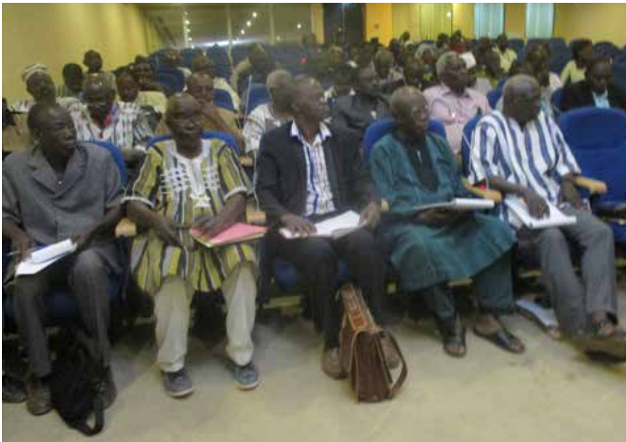
Les travailleurs déflatés..

KAMBOU les montants varient d'une société à une autre. Pour le moment, le président du HCRUN dit ne rien promettre aux ex travailleurs mais rassure tout de même que son institution mettra tout en œuvre pour que le droit soit dit.