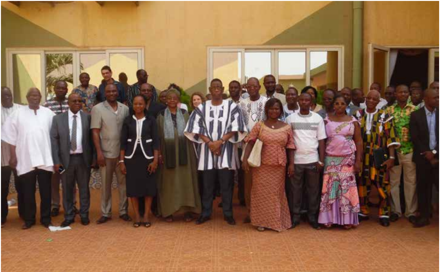
Les membres des organismes techniques en charge des NDT, posant pour la postérité.

d'atteindre les résultats escomptés selon le Ministre Bassiere. C'est pourquoi, les ODD qui ont été adoptés en 2015, soulignent la nécessité de la protection et la gestion durable des écosystèmes surtout dans leur volet préservation des terres et auquel le Burkina Faso, qui perd 360 hectares par an, a fait vite d'adhérer à l'instar des 103 pays à travers le monde. Un organisme intitulé Programme d'Etablissement de Cibles a été créé en vue d'accompagner