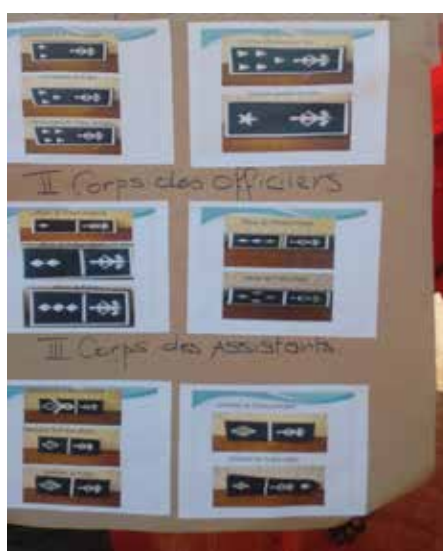
Grades des services de police.