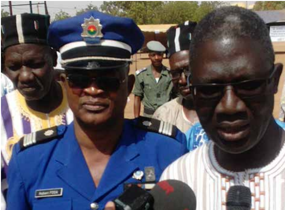
Le gouverneur et le commandant de gendarmerie.

pour une bonne collaboration car, dit-t-il, renseigner les forces de sécurité c'est d'abord assurer sa propre sécurité.