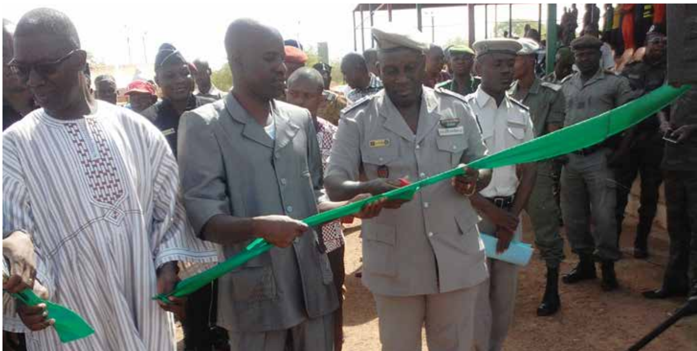
Coupure de ruban.

D ans un contexte où les services de sécurité sont beaucoup sollicités, la police en collaboration avec la gendarmerie, a organisé des journées portes ouvertes les jeudi 30 et vendredi 31 Mars 2017 à la place de la nation de Ouahigouya.