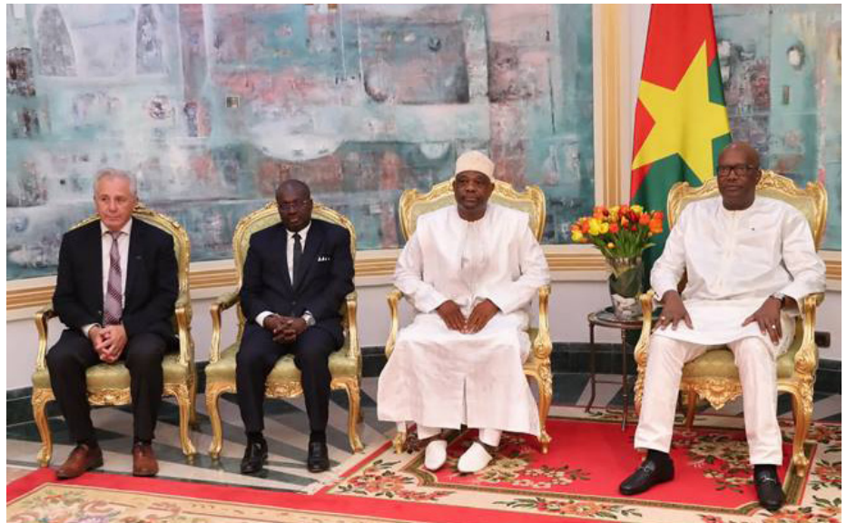
Une délégation d'opérateurs économiques d'Afrique et de la France chez le président du Faso.