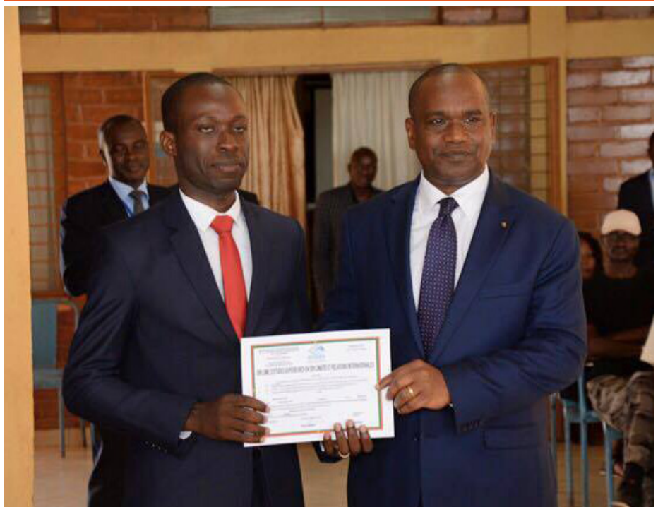
Le ministre des Affaires étrangères, de la Coopération et des Burkinabè de l'Extérieur S.E.M. Alpha Barry, a également félicité les impétrants.