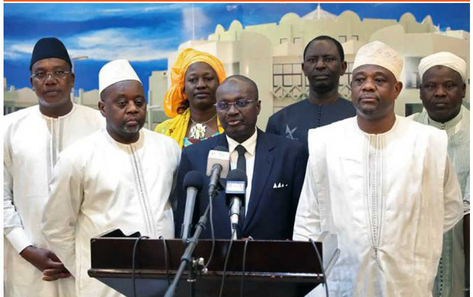
Le porte-parole de la délégation a rapporté que le Président du Faso a positivement apprécié cette démarche et prodigué des conseils et recommandations.